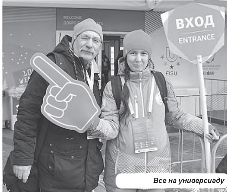
Все на универсиаду

Молодежный Конвент - ежегодное событие, которое объединяет талантливую молодежь