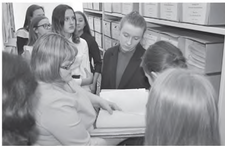
Экскурсия в районный архив

В виде небольшой игры была проведена презентация выставки «С любовью к родному городу», посвященная 85-летию со дня преобразования рабочего поселка Иланский в город. Учащиеся с интересом рассматривали