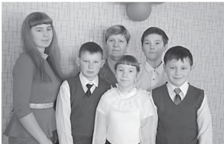
Новоникольские артисты и их руководители

В Новоникольском сельском клубе культурная жизнь бьет ключом! Одно мероприятие интереснее другого!