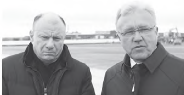
Виктор Потанин и Александр Усс

Из финансового отчета ПАО «ГМК «Норильский никель» по МСФО за первое полугодие 2020 года следует, что чистая прибыль компании упала сразу до 45 млн долларов США. Это связывается с резервированием средств на уплату экологического ущерба после аварии на ТЭЦ-3 в конце мая, следует из материалов компании. При этом консолидированная выручка «Норникеля» за январь-июнь составила 6,7 млрд долларов. Произошло это за счет роста биржевых цен на палладий, родий и золото, а также планового наращивания выпуска продукции на Быстринском ГОКе компании.