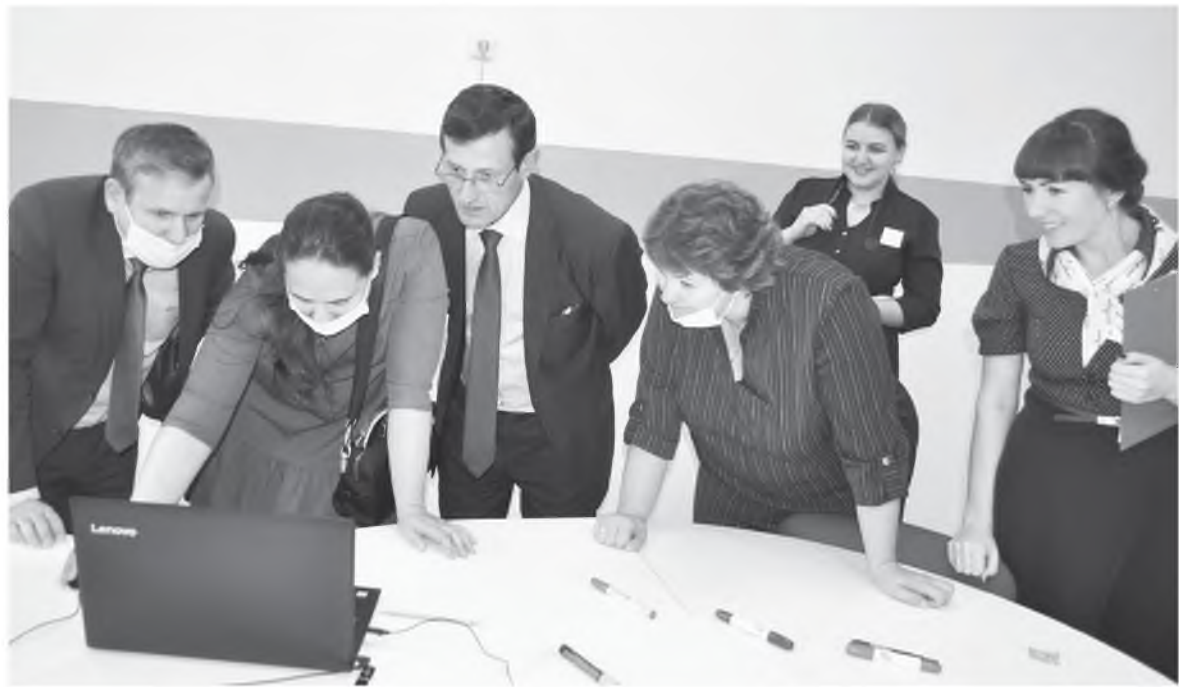
«Точка роста» в Новониколаевской школе

Я и мои коллеги регулярно общаемся с педагогами, родителями школьников, обсуждаем вопросы по организации образовательного процесса, оперативно реагируем на проблемы. Работа ведется в тесном сотрудничестве с Министерством образования Красноярского края и профильными ведомствами в территориях края. Многого уже удалось достичь, но есть вопросы, которые мы постоянно держим на контроле. Будем этим заниматься и дальше.