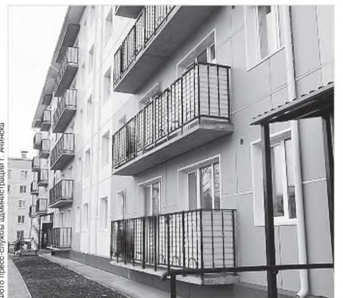
Все 85 квартир переданы новоселам с чистовой отделкой и полностью готовы для проживания