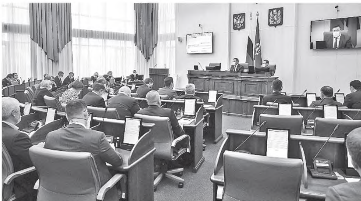
Повестка первого заседания X сессии была очень насыщенной