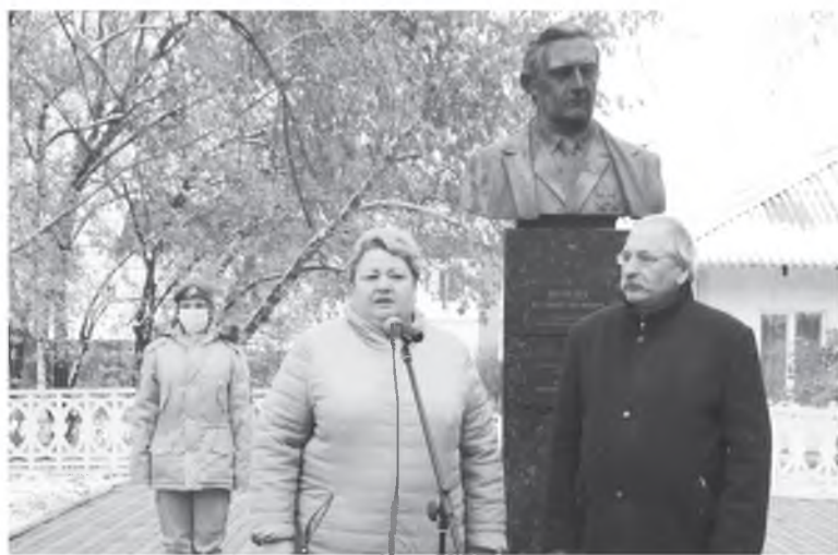
Митинг памяти Владимира Долгих

Владимир Иванович был непревзойденным профессионалом, умел мыслить стратегически, искренне любил свое дело и глубоко уважал людей, работающих на