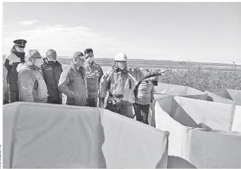
Заполярной территории еще долго придется восстанавливаться после экологического ЧП. И средства от штрафа основного виновника необходимы для ликвидации последствий нефтеразлива

Тем не менее усилия краевых властей не прошли даром. Их аргументы услышали в российском правительстве. Уже после принятия закона Госдумой премьер-министр Михаил Мишустин заявил о том, что основные средства от штрафа «Нор-