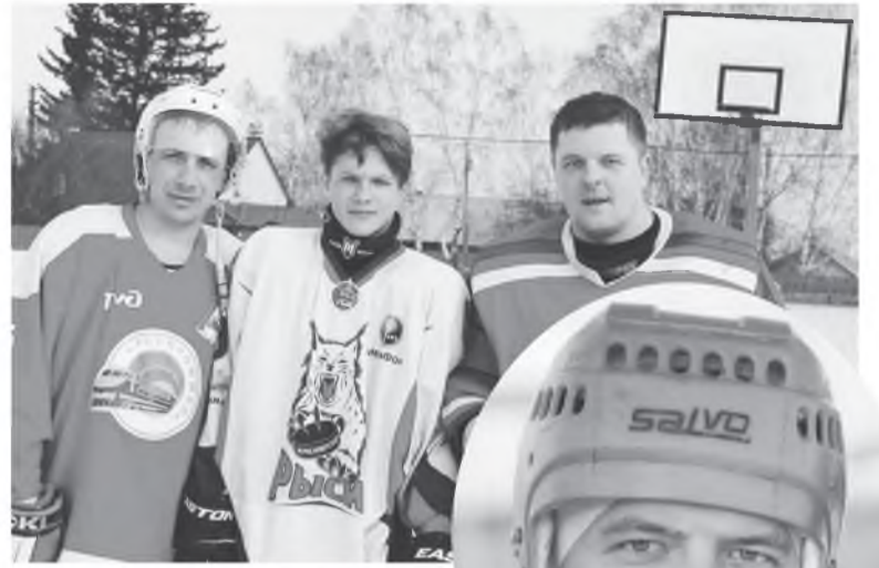
О спорт! Ты - жизнь!

Нагрузки, конечно, значительно возросли, и физические, и психологические, постоянно приходится быть на «связи» со своими службами, чтобы оперативно реагировать на все рабочие моменты производства. Поэтому о стабильном режиме работы с 8 до 17 наш герой даже и не мечтает, производственные дела приходится решать в течение суток, в любое время. Но он не ропщет, потому что прекрасно знал, какую непростую профессию выбрал. Он никогда не пожалел о своем выборе, другой работы для себя просто не представляет.