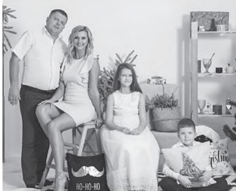
Главней всего - погода в доме