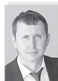
Константин Николаевич ДИМИТРОВ – министр транспорта