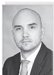
Егор Евгеньевич ВАСИЛЬЕВ – министр экономики и регионального развития