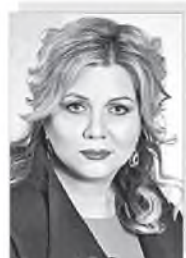
Марина Юрьевна ПОНОМАРЕНКО – министр тарифной политики