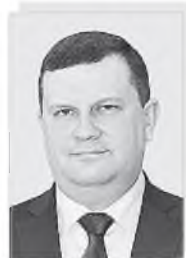
Димитрий Александрович МАСЛОДУДОВ – министр лесного хозяйства