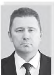
Евгений Евгеньевич АФАНАСЬЕВ – министр промышленности, энергетики и жилищно-коммунального хозяйства