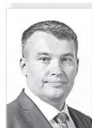
Виталий Степанович ДЕНИСОВ – министр здравоохранения