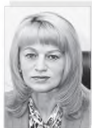
Светлана Ивановна МАКОВСКАЯ – министр образования