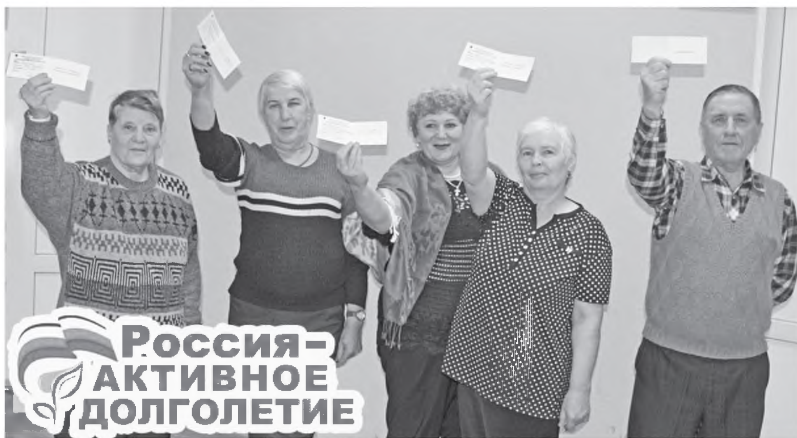
Студенческие билеты получили!

В народных университетах Красноярского края начался новый учебный год.