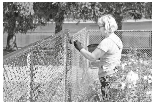
Общественные работы в Таятах: ремонт ограды памятника

– Благодаря взаимодействию центра занятости с предпринимателями района на восемь предприятий создано 27 временных рабочих места для безработных и ищущих работу граждан. Работодателям в основном требовались подсобные рабочие, грузчики, разнорабочие для проведения благоустройства. Согласно вышеуказанному нормативному акту, им гарантирована оплата труда не ниже ее минимального показателя. Центр занятости населения компенсирует работодателю расходы по заработной плате в размере минимальной. Кроме того, субсидия предусматривает финансовое возмещение на оплату налогов и сборов за принятого человека. Это нововведение окажет существенную помощь обеим сторонам договора: поддержит бизнес и позволит жителям трудоустроиться. Пока инициатива краевого правительства носит временный характер. Период уча-