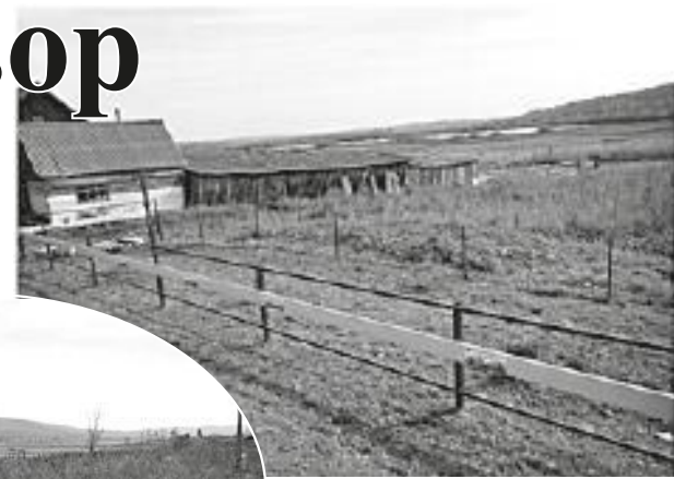
с. Черемушка, аллея Памяти на месте пустыря

дят за своими домами (фасадами и ограждениями) и придомовыми территориями, но есть и такие, которые пренебрегают элементарной уборкой мусора и скашиванием травы возле своего жилья. Вот лишь некоторые примеры домов, где собственники следят за благоустройством и где на это не особо тратят свое время: