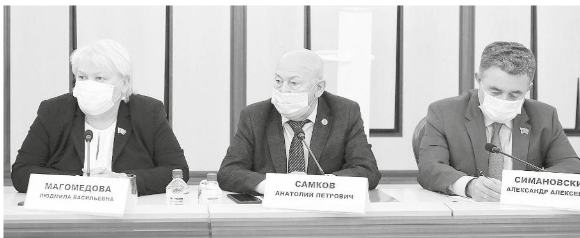
Во время нулевого чтения бюджета краевые парламентарии высказали немало предложений

Комитеты в установленные законом сроки должны будут, внимательно проанализировав представленные материалы, подготовить