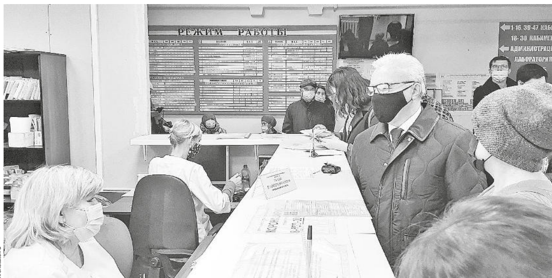
Александр УСС лично убедился: краевые медики готовы работать в условиях подъема заболеваемости

В целом проект бюджета получился сбалансированным и дееспособным. Приоритетами бюджетной политики края в ближайшую трехлетку остаются финансирование национальных проектов и сохранение всех социальных гарантий и обязательств перед людьми. По прогнозам, доходы региона в 2021 году достигнут 259,2 млрд рублей, расходы составят 273,9 млрд рублей. Дефицит – 14,7 млрд рублей.