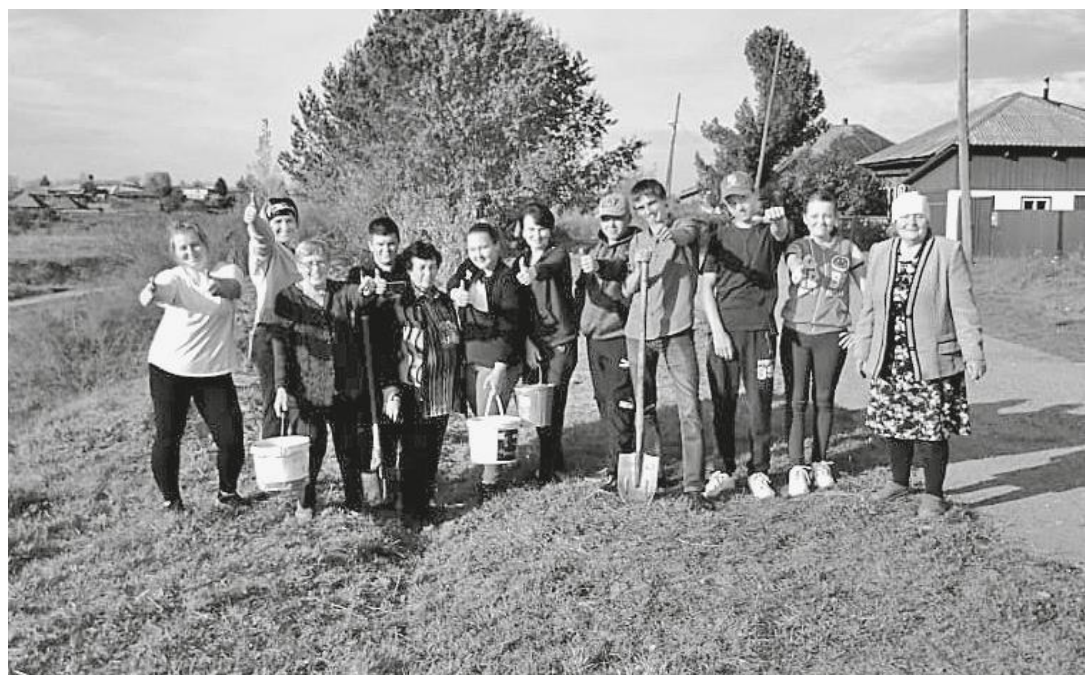
Групповая фотография участников закладки сквера в районе пересечения улиц Партизанской, Зеленой и Гоголя

4 ноября россияне отмечают День народного единства. Праздник молодой – введен с 2005 года. История дня уходит в 1612 год, когда 4 ноября (по новому стилю) народное ополчение под руководством князя Дмитрия Михайловича Пожарского и Нижегородского земского старосты (в переводе на современный язык – главы одного из Нижегородских районов) Кузьмы Минина выдвинуло из Москвы польских интервентов.