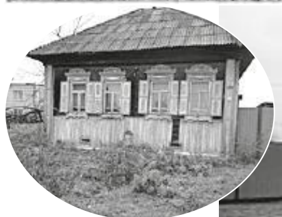
с. Нижний Кужебар