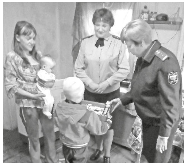
Подарки для детей от судебных приставов

В целях обеспечения безопасности здоровья наших посетителей сотрудники службы организовали предварительную запись на прием. Рекомендуем гражданам пользо-