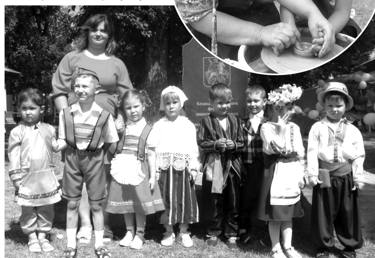
Воспитанники детского сада «Сказка» в национальных костюмах народов, проживающих в районе