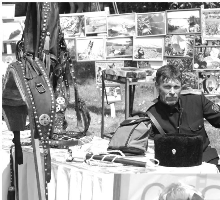
Конная упряжь ручной работы мастера В.Сысова