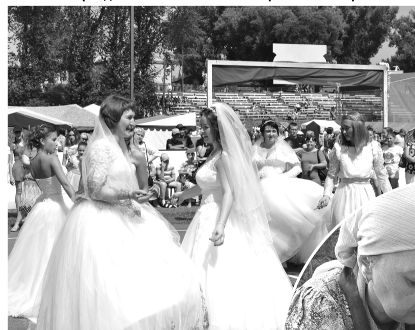
Бум невест – еще один повод достать свадебное платье и показать таланты в творческих конкурсах