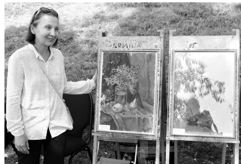
На «каратузском арбате»