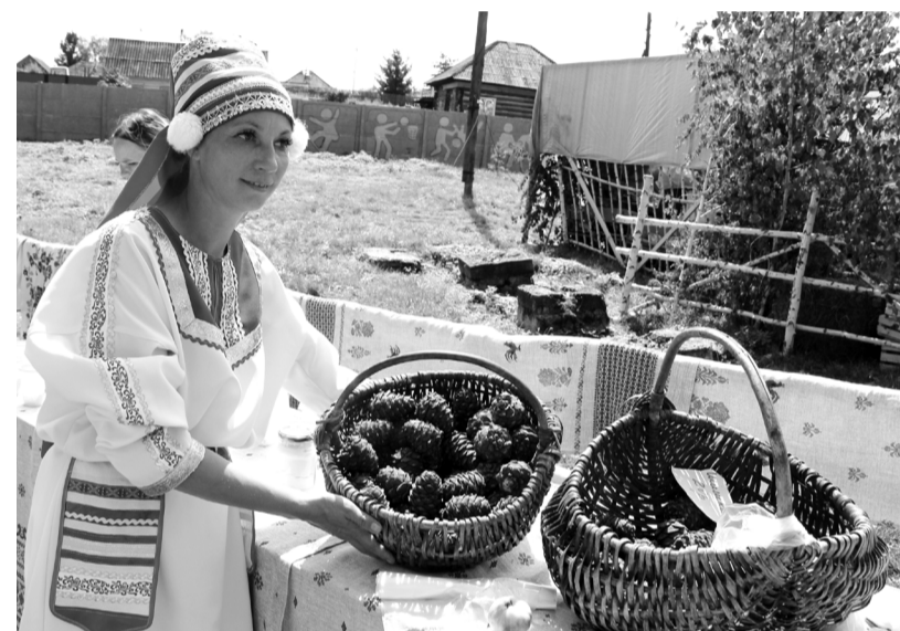
Верхний Кужебар богат таежными дарами