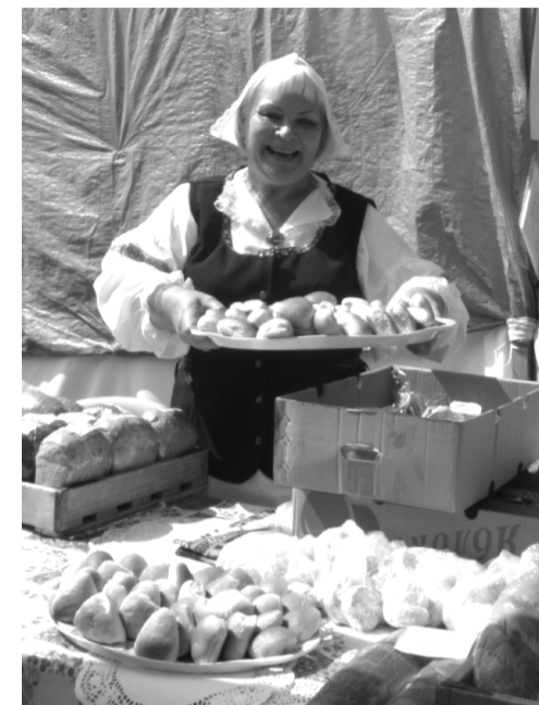
Моторские пирожки и булочки – известный бренд