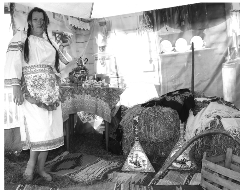
В нижекурятской «избе»