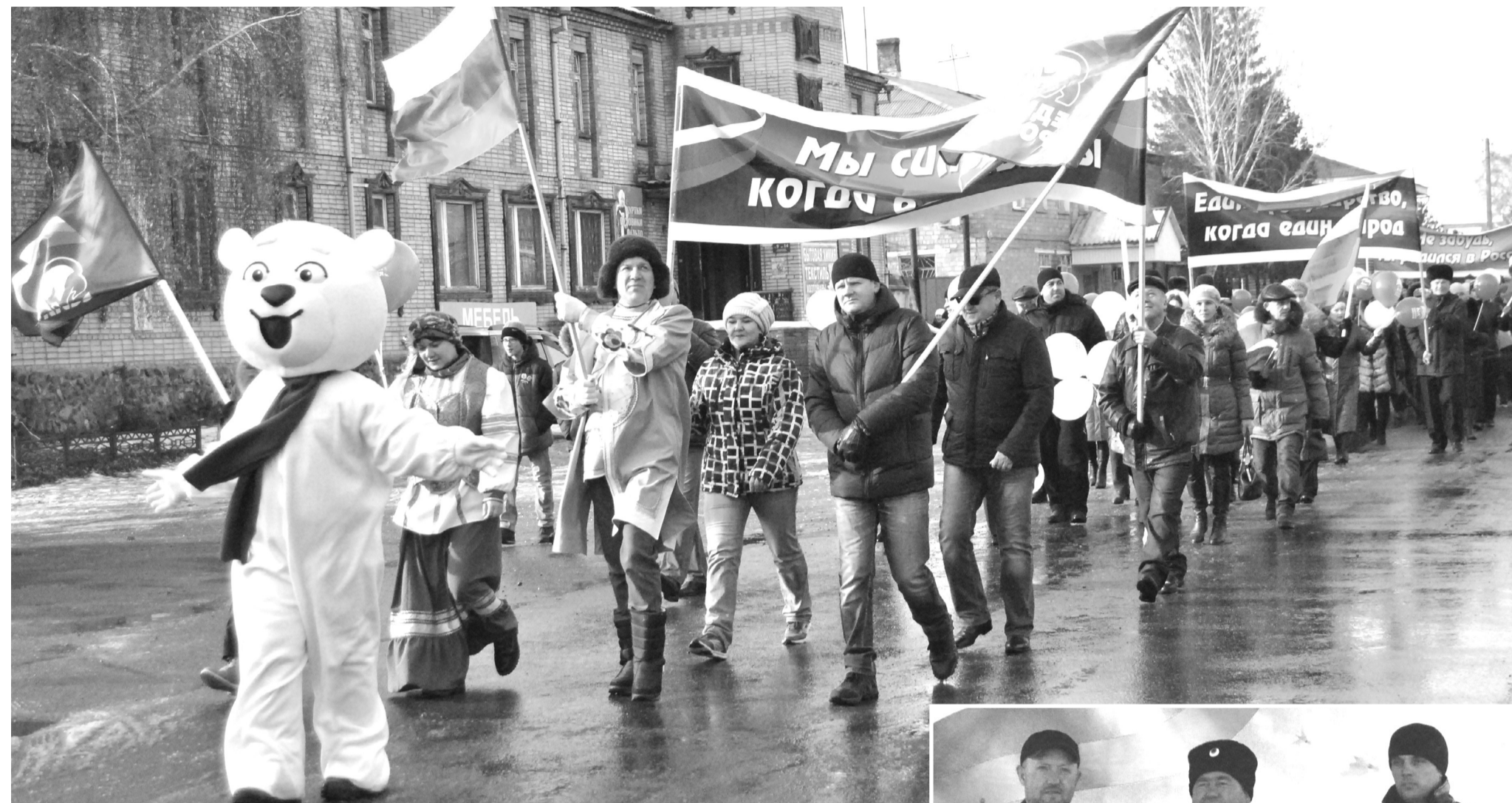
По главной улице с улыбкой

День народного единства в райцентре был необычным. Маленький экскурс в историю, но-стальгические нотки – по главной улице под бравурные марши прошла нарядная колонна. Бесспорно, отмечали новый праздник, но так знакомо было все это. Транспаранты, флаги, шарики, в колоннах – взрослые, школьники, малыши. И зрители. Несмотря на морозец, жители собрались. Улыбки расцвели ноябрьский денек.