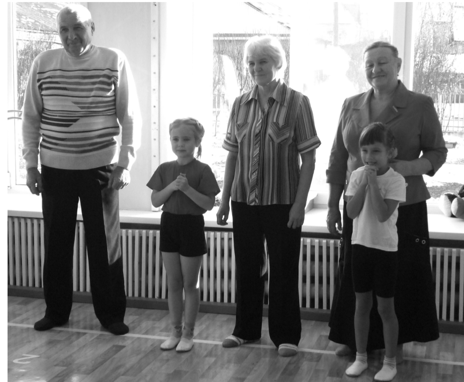
Дошколята в команде с бабушками и дедушками

Весёлый спортивный праздник закончился дружным чаепитием со сладкими пирогами. И взрослые, и дети были рады своим успехам. Ведь победили все. Молодцы бабушки и дедушки, что откликнулись, оставили свои домашние хлопоты и пришли поиграть с детьми.