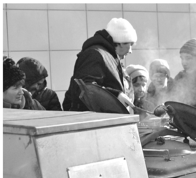
Вкусна наша каша