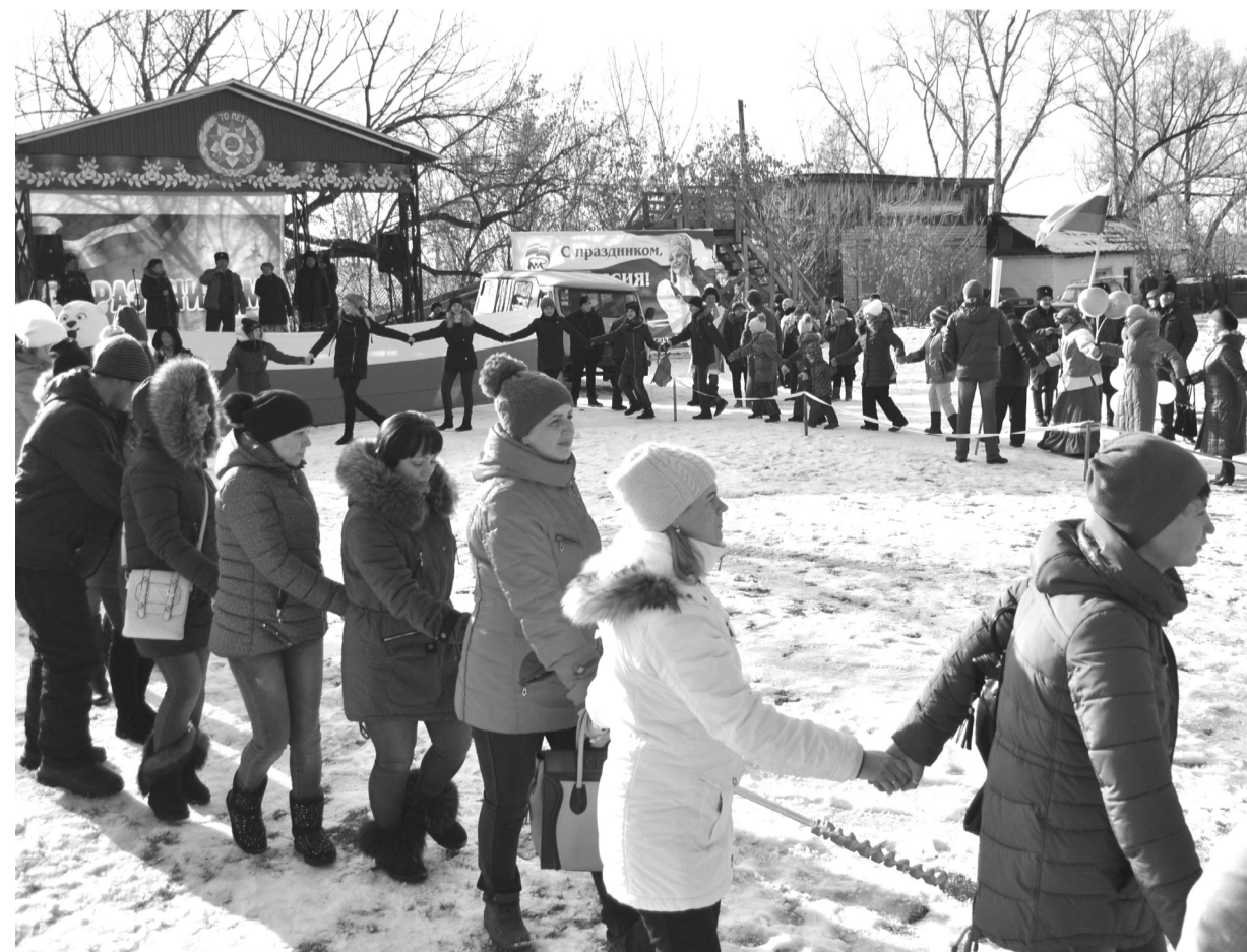
Так давайте устроим большой хоровод, пусть все люди земли с нами встанут в него