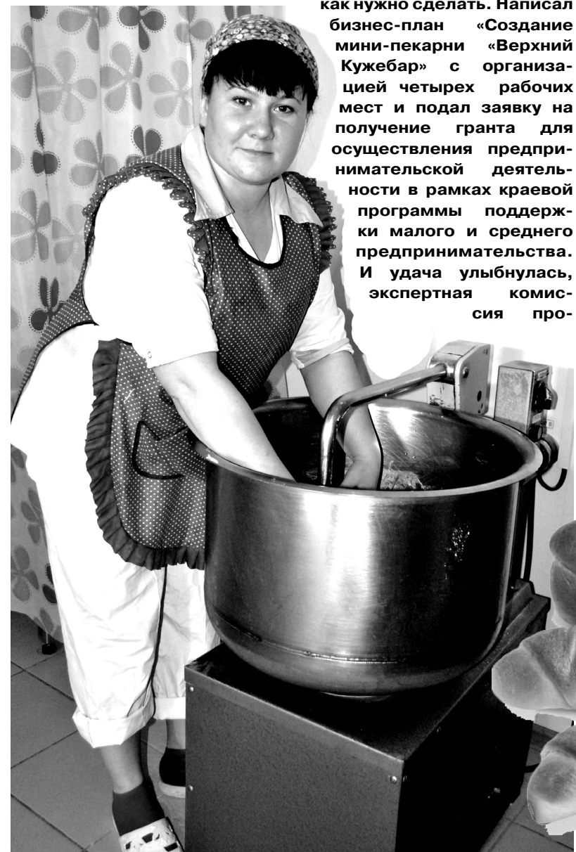
Тесто для очередной партии булочек на подходе

Выявление насекомых и их идентификацию проводят при осмотре лесопроductии и в ходе проведения фитосанитарной экспертизы. Заготовителям и продавцам лесного богатства нужно помнить об этом и выполнять все требования действующего законодательства.