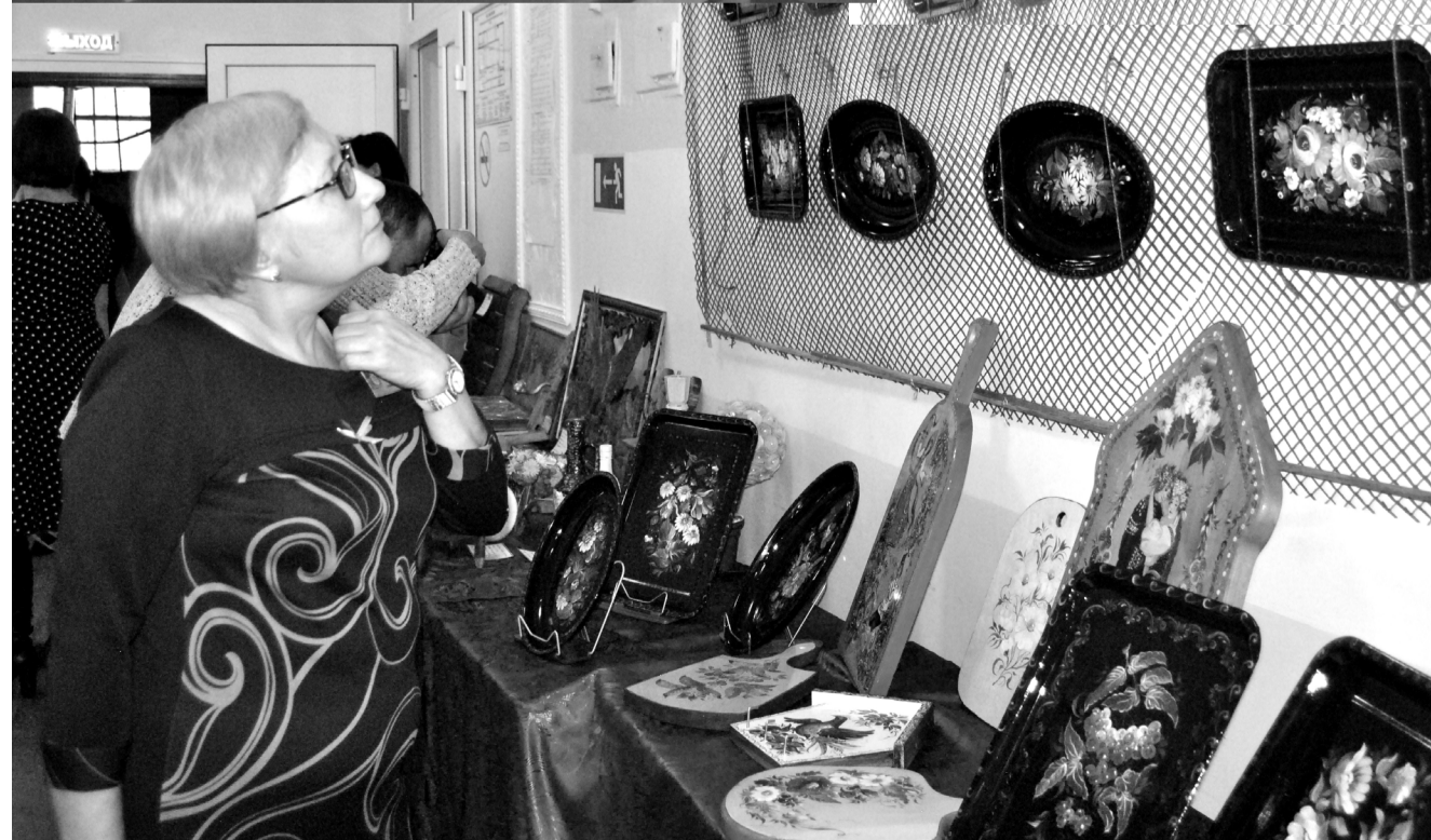
Выставка декоративно-прикладного творчества вызвала восхищение у всех присутствующих