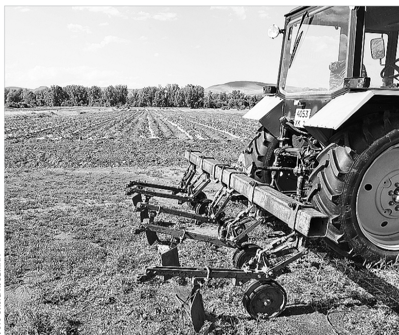
Предприниматели южных районов края получают более 20 миллионов рублей в виде господдержки

Более 20 миллионов рублей получают в виде господдержки предприниматели южных районов края. Предприниматели, которые занимаются сбором дикоросов, смогут реализовать продукцию через сеть пунктов приемки: