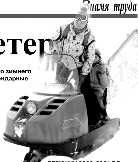
ДЕВУШКИ 2000-2001 Г.Р., 2 КМ

болельщиков. Призеры соревнований по возрастным категориям (приведены ниже) награждены грамотами и спортивными шапочками с эмблемой Лыжни России.