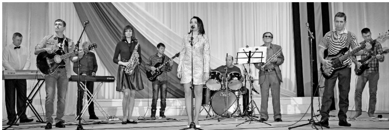
Кавер-группа «Черная соль». На концерте в честь Дня защитника Отечества

Минувший год был немного грустен, и не только потому, что мы боялись и прятались за масками, и не потому, что проблемы, казалось, сыпались со всех сторон. Наверное, сложнее всего стало то, что он развездил всех, отправив на самоизоляцию. Против ограничений не пойдешь, и потому практически закрылись двери всех культурных заведений. Хлеба всем нам все же хватало, а вот зрелищ... Что-то появлялось в соцсетях, но любой, даже самый качественный контент не несет в себе ту, особую атмосферу праздника и радости – это можно ощутить только рядом, глаза в глаза.