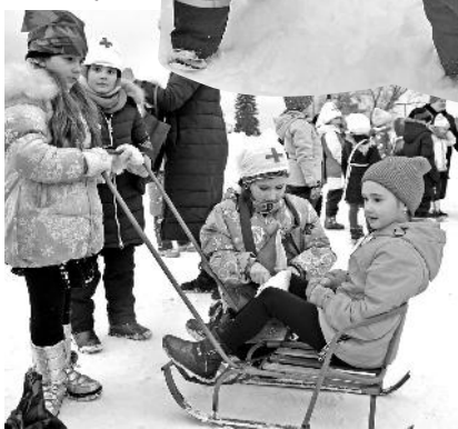
Главное – правильно закрепить повязку. «Скорая» на старте!

взрывоопасный груз и дать старт следующему этапу – доставке раненого в медцеху. Условно пострадавшим санитары немедленно оказывали первую медицинскую помощь, и забинтованного скорые на помощь сани мчали в больницу.