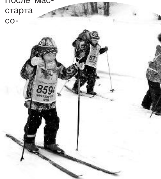
На дистанции – дошколята

стоялись забеги на дистанции в разных возрастных группах. В этом году учащиеся спортивной школы соревновались в отдельной