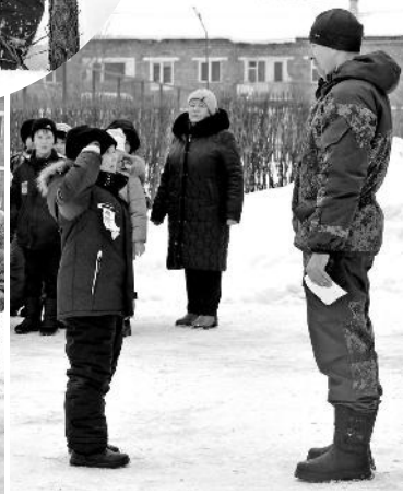
– Товарищ главный судья соревнований. Взвод для военно-спортивной игры «Зарница» построен.

приобрели навыки ориентирования на местности, проявили умение работать в команде и физическую подготовку.