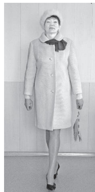
Демисезонное пальто, 1966 г.

Ждем ваших фото. А вот какие ремиксы получились у нас: