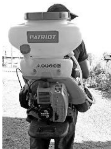
Оснащение для добровольцев-пожарных

26 мая в результате сильного ветра сорвана крыша с корпуса №3 каратузской школы. Ущерб от ЧС – почти 10 млн. рублей. Благодаря работе администрации района были выделены необходимые денежные средства из краевого резервного фонда на замену крыши.