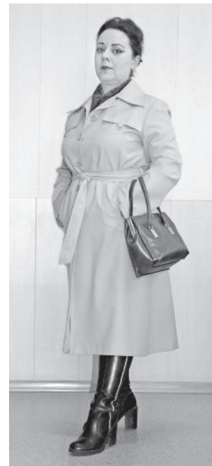
Плащ сезона 1975 года