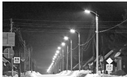
Новое освещение в Моторском