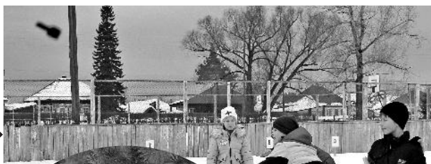
– По танкам «боевыми» гранатами пли!

Эта игра принесла им не только новые знания и положительные эмоции, но и проверила их дружбу, сплоченность в испытаниях. Дети