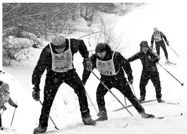
Подъем штурмуют мужчины

Массовый старт участников по традиции проходил первым, но в этот раз лыжно дали самым маленьким участникам – дошколятам. После старта со-