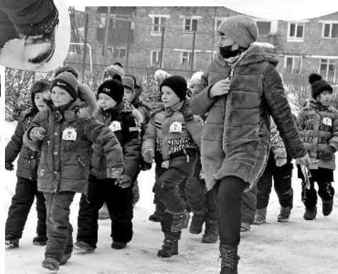
– Песню запе-вай! – У солдата выходной, пуговицы в ряд...