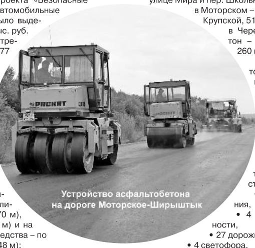
Устройство асфальтобетона на дороге Моторское-Ширьштык