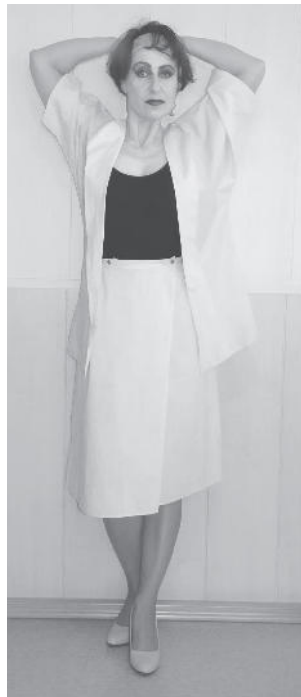
Летний костюм, 90-годы

В КГБУЗ «Каратузская РБ» продолжается вакцинация от COVID-19. На 17 февраля 266 жителей получили первую дозу прививки. Сейчас в Каратузском районе прививку можно сделать только в поликлинике, в прививочном кабинете №123, в понедельник, среду – в течение рабочего дня, в четверг – с 13:00, в субботу – с 11:00 до 14:00.