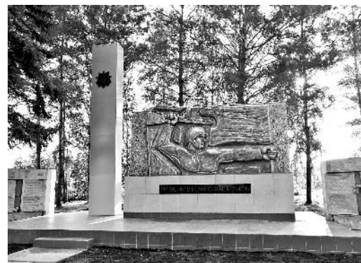
Отремонтированный мемориал в Шырыштыке