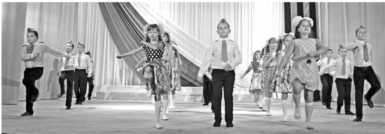
Хореографический ансамбль «Арабеск» (старшая группа)

ПЕРВАЯ радостная новость пришла накануне новогодних праздников – «Культурная столица Красноярья» осталась у нас. Оно и верно, пусть и не по своей воле, но обещающую яркую программу выполнить не получилось. Так что сделать столицу второгодичей – для нас лучший вариант. Надежда увидеть, услышать, познакомиться с самыми лучшими коллективами, выставками и проектами нас не оставила.