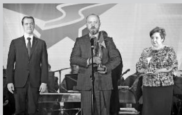
Открытие «Культурной столицы» в Каратузе

привлечено 846,224 руб., за счет них приобретена звуковая аппаратура в Верхнекужебарский СДК (300,0 тыс. руб.), пошиты зимние костюмы для народной вокальной группы «Аквапель» (304,6 тыс. руб.), приоб-