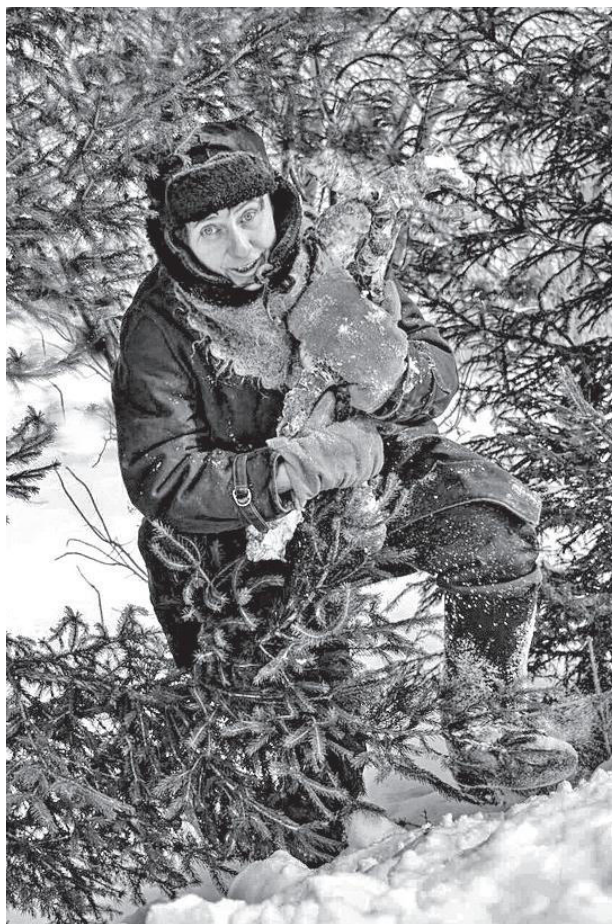
Зимняя мода покорителей Сибири 1961 г. Ремикс редакции

ВЕСНА обновляет не только природу, но и наш взгляд на мир. Мы вдруг замечаем, как много рядом красивых женщин. И так было во все времена. С наступлением весны привлекательность прекрасной половины человечества как-то особенно бросается в глаза. «Как с картинки» – говорили порой о модных особах. Безусловно, в их числе были и наши мамы и бабушки – во времена их молодости мода, в том числе и на прически, была более выразительна и подчеркивала красоту и женственность.