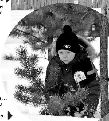
Интересно... «растут» ли мины под елкой?