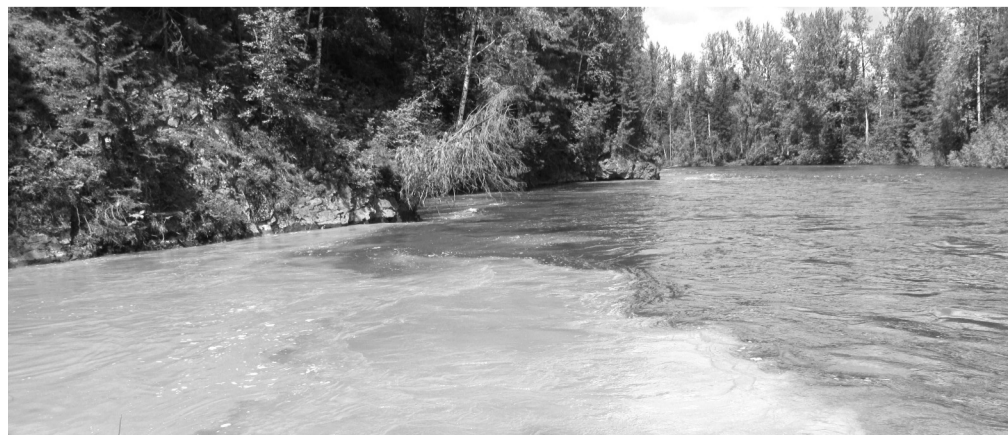
Серая муть при впадении реки Зибизян в Амыл