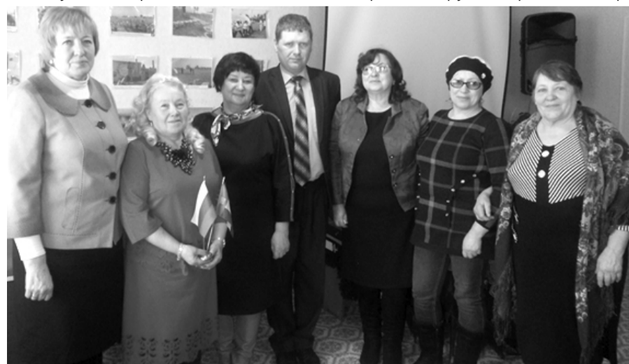
Каратузская делегация в гостях в соседней республике