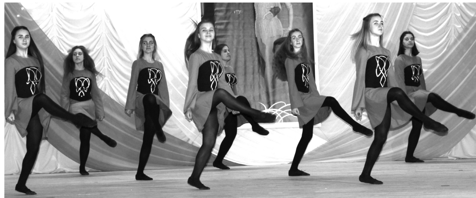
Ансамбль «Liri dance». «Прогулка»