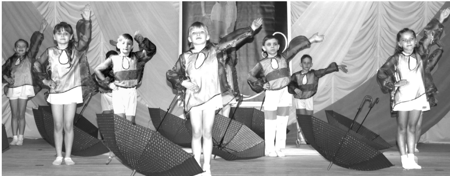
Воспитанники студии хореографического искусства «Ноу-хау»

Седьмого апреля в центре культуры «Спутник» с. Каратузского состоялся традиционный конкурс хореографического мастерства «Хрустальный башмачок». В этом году выступить на сцене перед строгим жюри прибыли коллективы из райцентра (центр «Радуга», РЦК «Спутник», детская школа искусств, детский сад «Солнышко», частная хореографическая студия), Таскино, Сагайского, Нижнего и Верхнего Кужебаров. Одни ансамбли уже зарекомендовали себя в подобных мероприятиях, другие впервые вышли на большую сцену. Более сорока номеров посмотрели зрители и жюри. Сколько потрачено труда, времени, средств на костюмы, знают танцоры, педагоги и родители. За пятью минутами на сцене стоят месяцы репетиций, но все это оставлено за кулисами, а для гостей – улыбки и замечательные композиции.