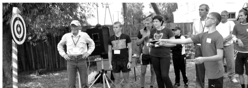
В дартсе пробные броски почему-то получались результативнее зачетных

Соревнования закончились. Но это только начало, небольшой шаг в сторону здоровья и хорошего настроения. Дорога к олимпийским медалям начинается с таких спортивных площадок. Ведь спортсмены Каратузского района неоднократно принимали участие и были призерами в краевых и зональных турнирах.