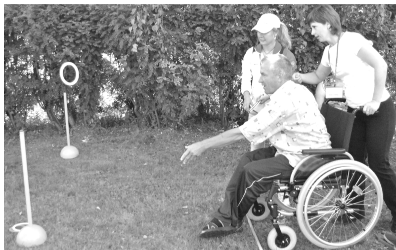
Эти колечки никак не хотели нанизываться на стойку