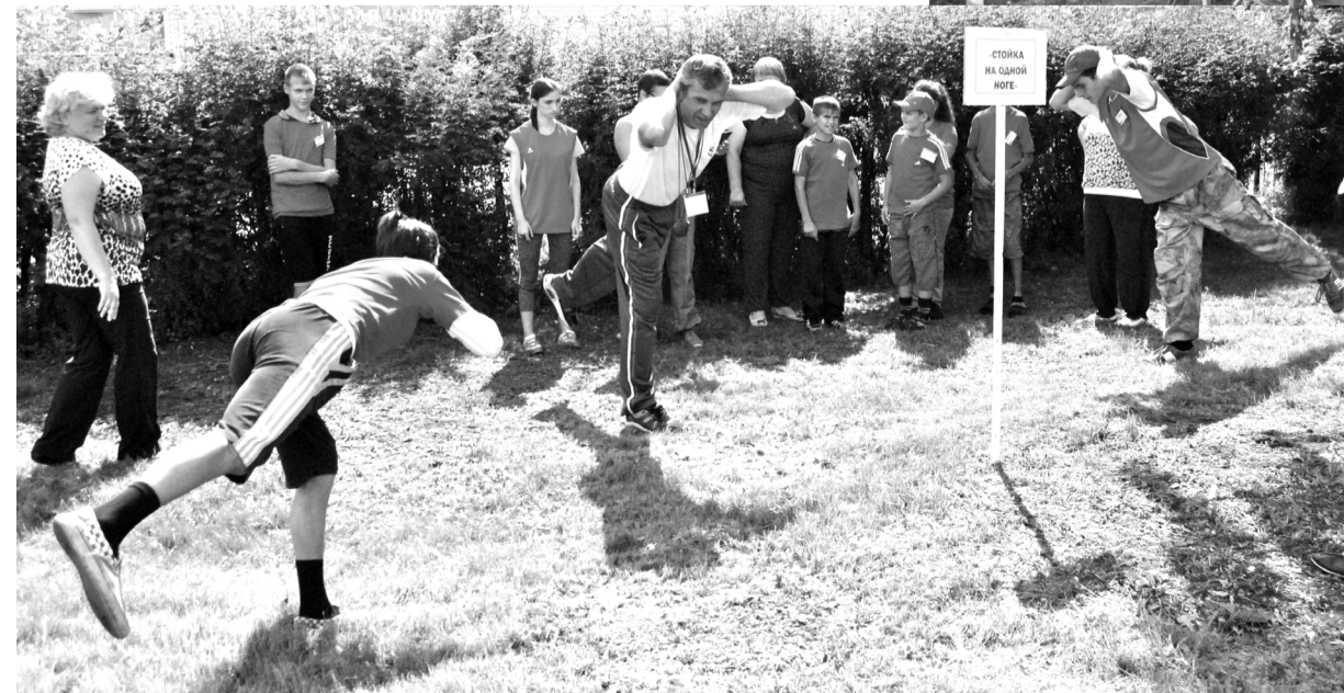
Выстоять на одной ноге долгое время смогли немногие

Подготовила Татьяна МИХАЙЛОВА, фото автора (АП)