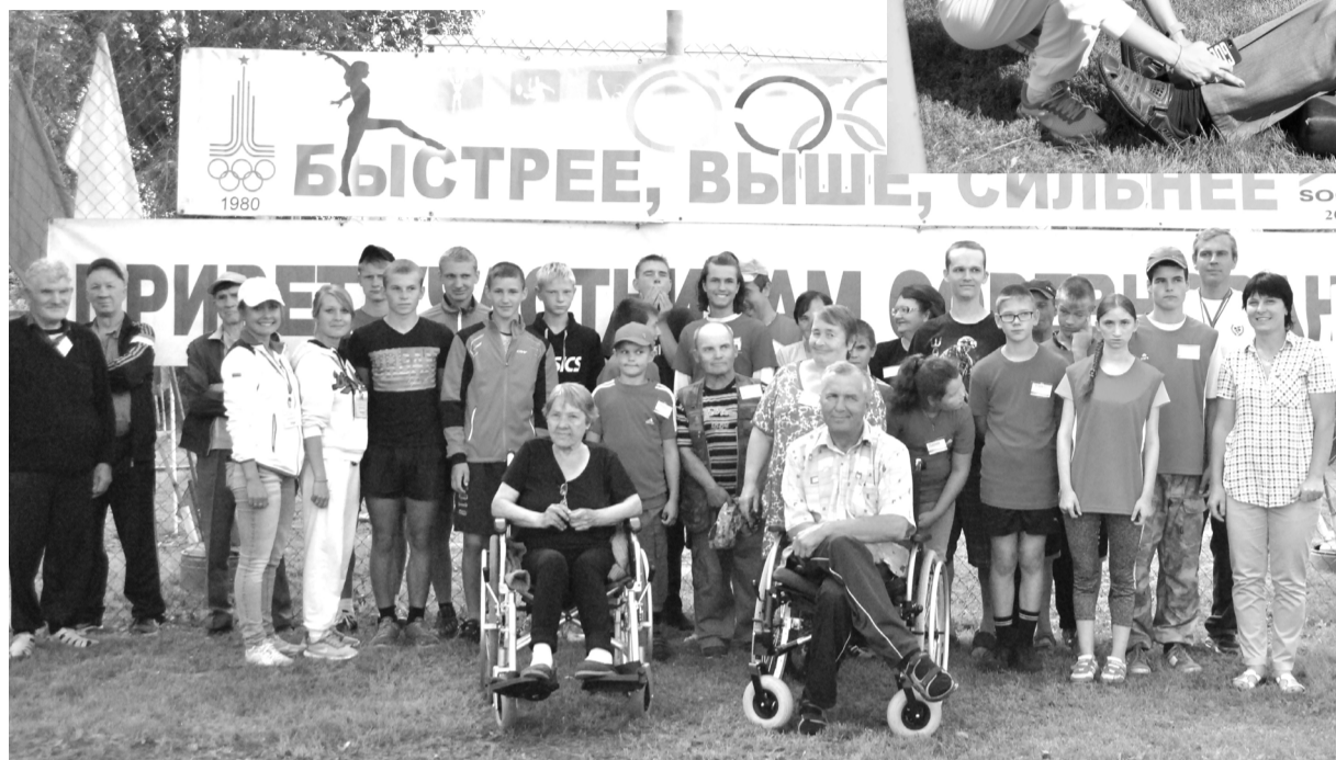
Участники спартакиады «Мы можем все!» с судьями соревнований

За каждым движением спортсменов внимательно следили судьи соревнований и волонтеры