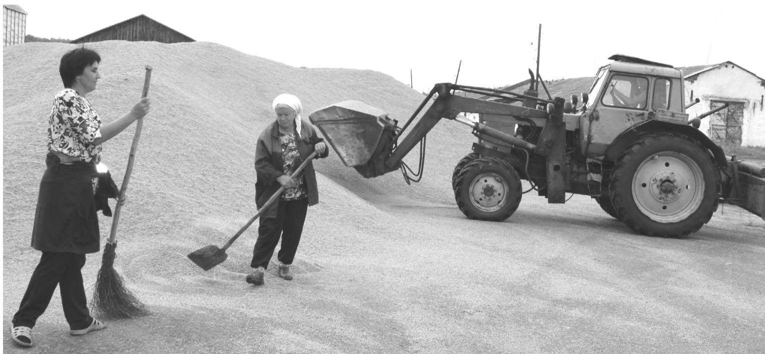
Более 700 тонн ячменя поступило на зерноток за один день уборки

Построенные в ряд на краю поля, что у асфальтобетонного завода, краковались в последних числах июля комбайны каратузского ДРСУ, готовые начать битву за урожай. И вот сигнал к старту уборочной поступил. 31 июля четыре комбайна «Полесье» поплыли по золотому ячменному морю. В первый день августа вышла на поля уже вся зерноуборочная техника ДРСУ, за исключением «Енисеев».