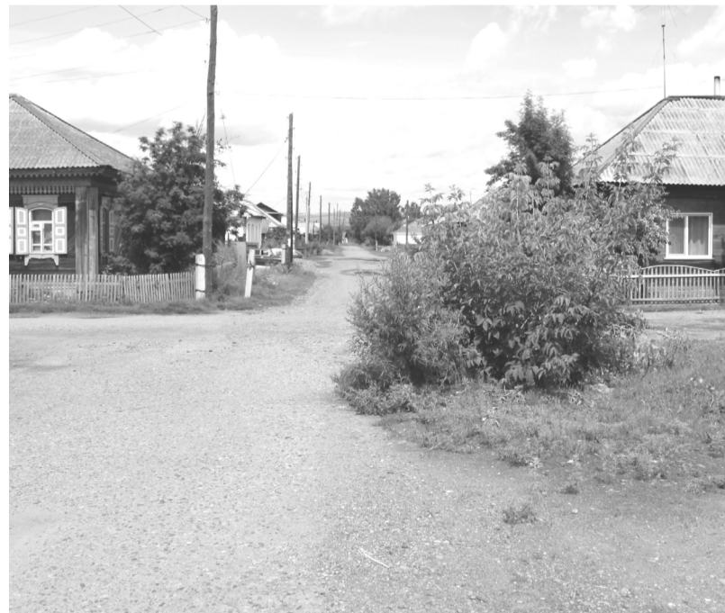
«Живописный» перекресток улиц Тельмана и Ярова в райцентре

«Оазис» прямо на пути – авто двум разом не пройти. «Помеху справа» за кустом не видно даже ясным днем. И в ширь, и в высь кустарник прет, А власть и ухом не ведет. Но даже если куст убрать, руль вправо лучше бы не брать: Колодец здесь от «ТВК», под крышкой – водная река. Нам не понять, чем думал тот, кто строил здесь водопровод.