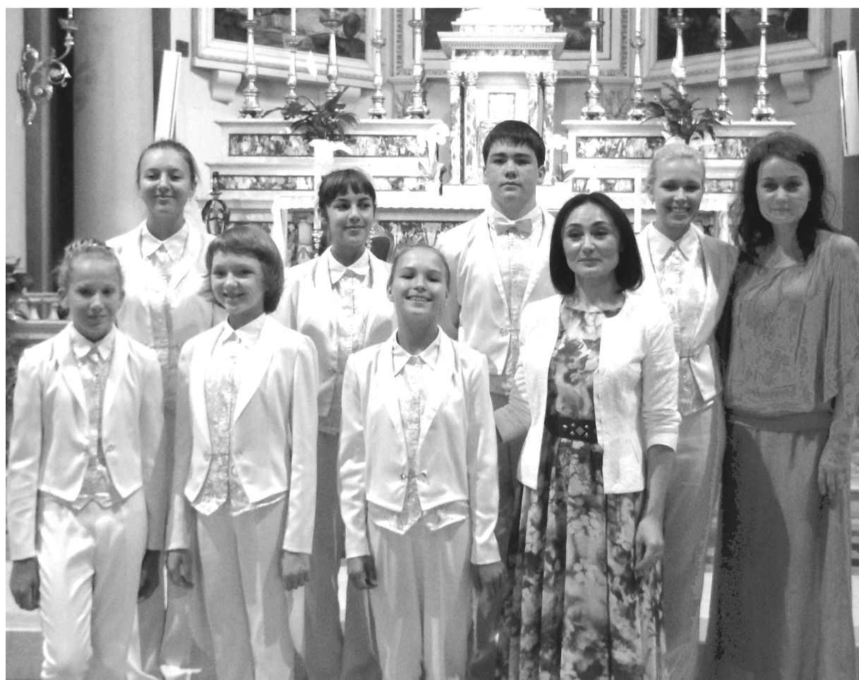
После воскресной службы в храме г. Монтефорте

Особенно полюбилась зрителям наша русская народная песня «Родина». Многие руководители даже попросили нотный материал. Возможно, в скором времени мы услышим эту песню на других языках.