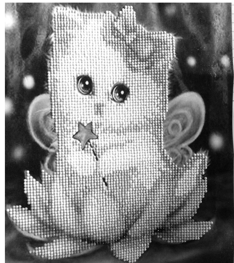
Картина в технике алмазной выкладки