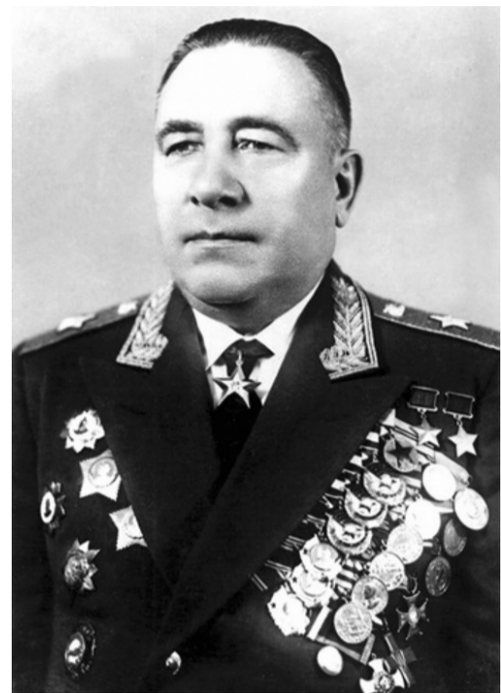
Командующий войсками 1-й танковой армии дважды Герой Советского Союза генерал-лейтенант танковых войск М.Е. Катюков

На рассвете мелкие группы пехоты и танков атаковали на всем фронте прорыва, чтобы дезориентировать советское командование о действительном направлении глав-