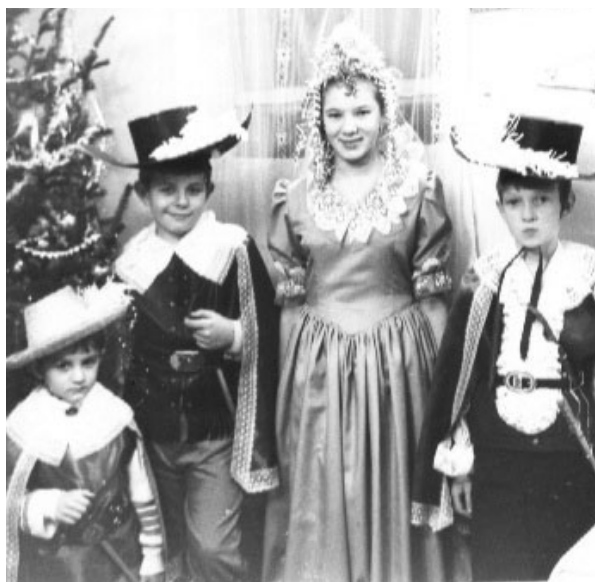
Одна из работ на конкурс «Ретрофото»

Совсем близко Новогодний праздник, а для редакции газеты «Знамя труда» – подведение итогов традиционных новогодних конкурсов. Но у вас, дорогие наши читатели, еще есть время принять участие в одном или нескольких из них и получить призы.