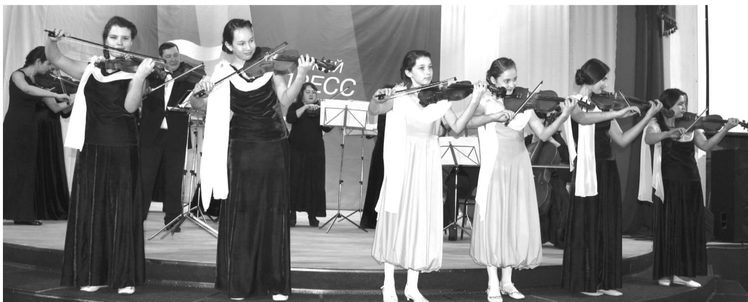
Юные скрипачки из Таят выступают вместе с музыкантами красноярского симфонического оркестра

3 и 4 февраля Каратузский район с рабочим визитом посетила первый заместитель министра культуры Н.Л. Гельруд и начальник отдела межрегионального и межведомственного взаимодействия министерства культуры Красноярского края И.И. Коренец.