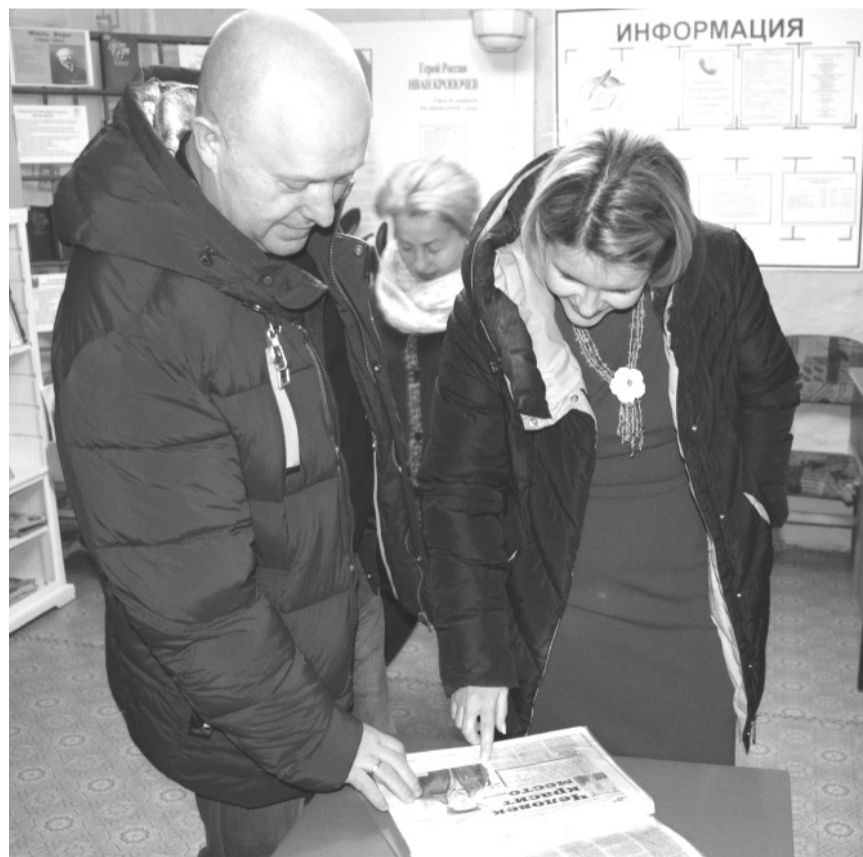
Гости с главой района в таятской библиотеке

Надежда АЛЕКСАНДРОВА