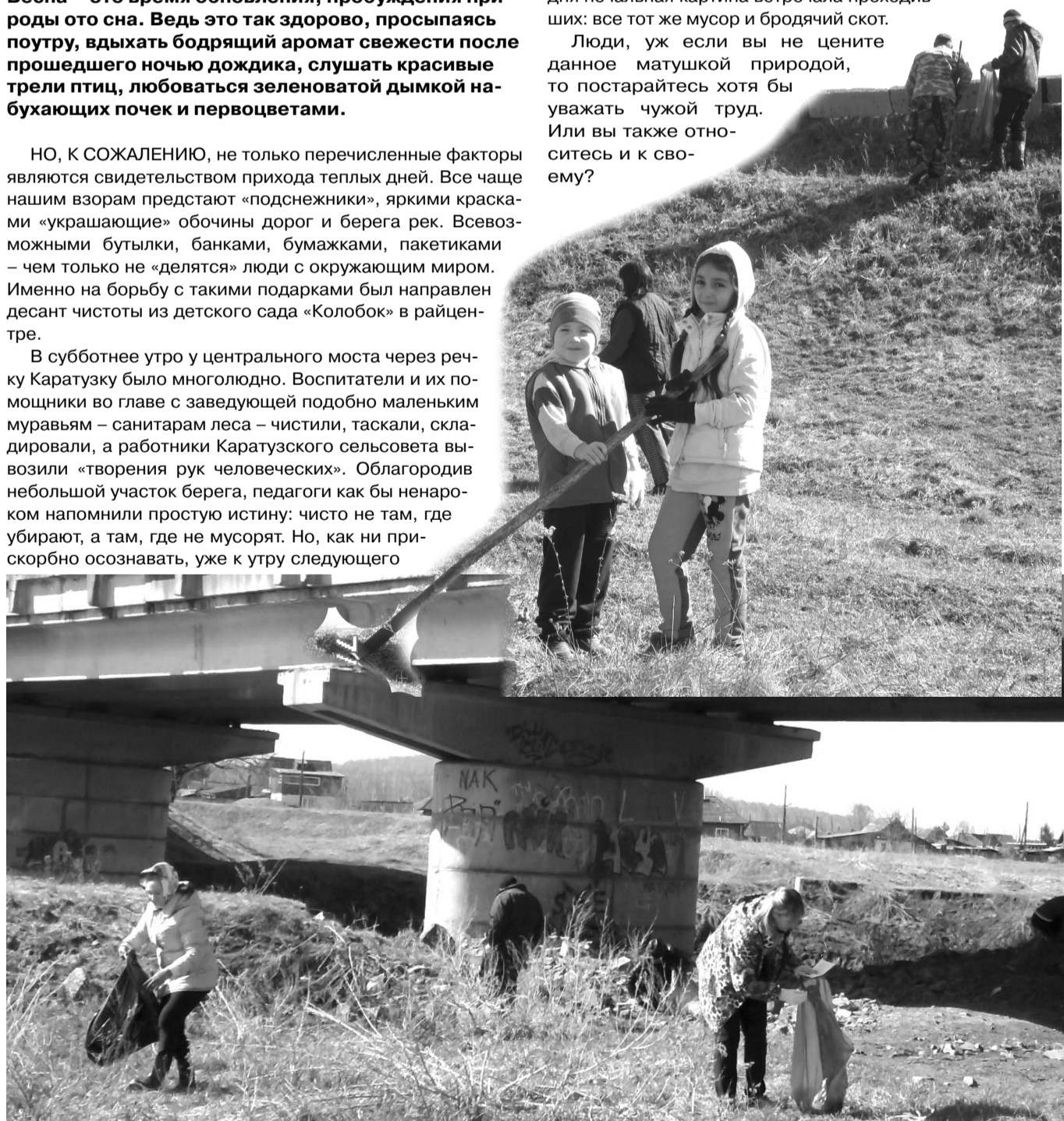
Для работников и воспитанников детского сада «Колобок» слова: «Чистота – залог здоровья» – не пустой звук

Люди, уж если вы не цените данное матушкой природой, то постарайтесь хотя бы уважать чужой труд. Или вы также относитесь и к своему?