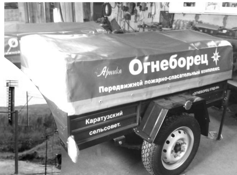
Огнеборец для Среднего Кужебара

Каратузский сельсовет приобрел пожарно-спасательный комплекс «Огнеборец». В целях обеспечения пожарной безо-