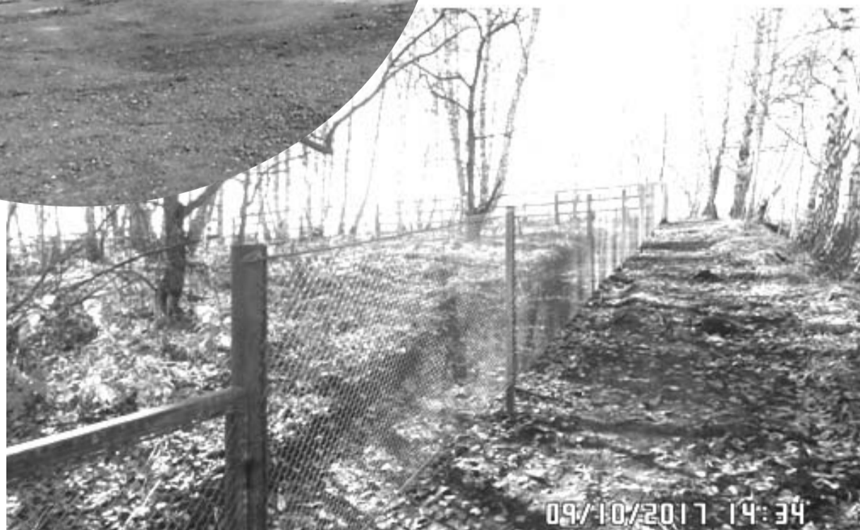
На средства гранта было облагорожено кладбище в Старомолино

пасности Среднего Кужебара выполнены работы по ремонту помещения для хранения комплекса. Подрядчик – ООО «Арика» из г. Красноярска.