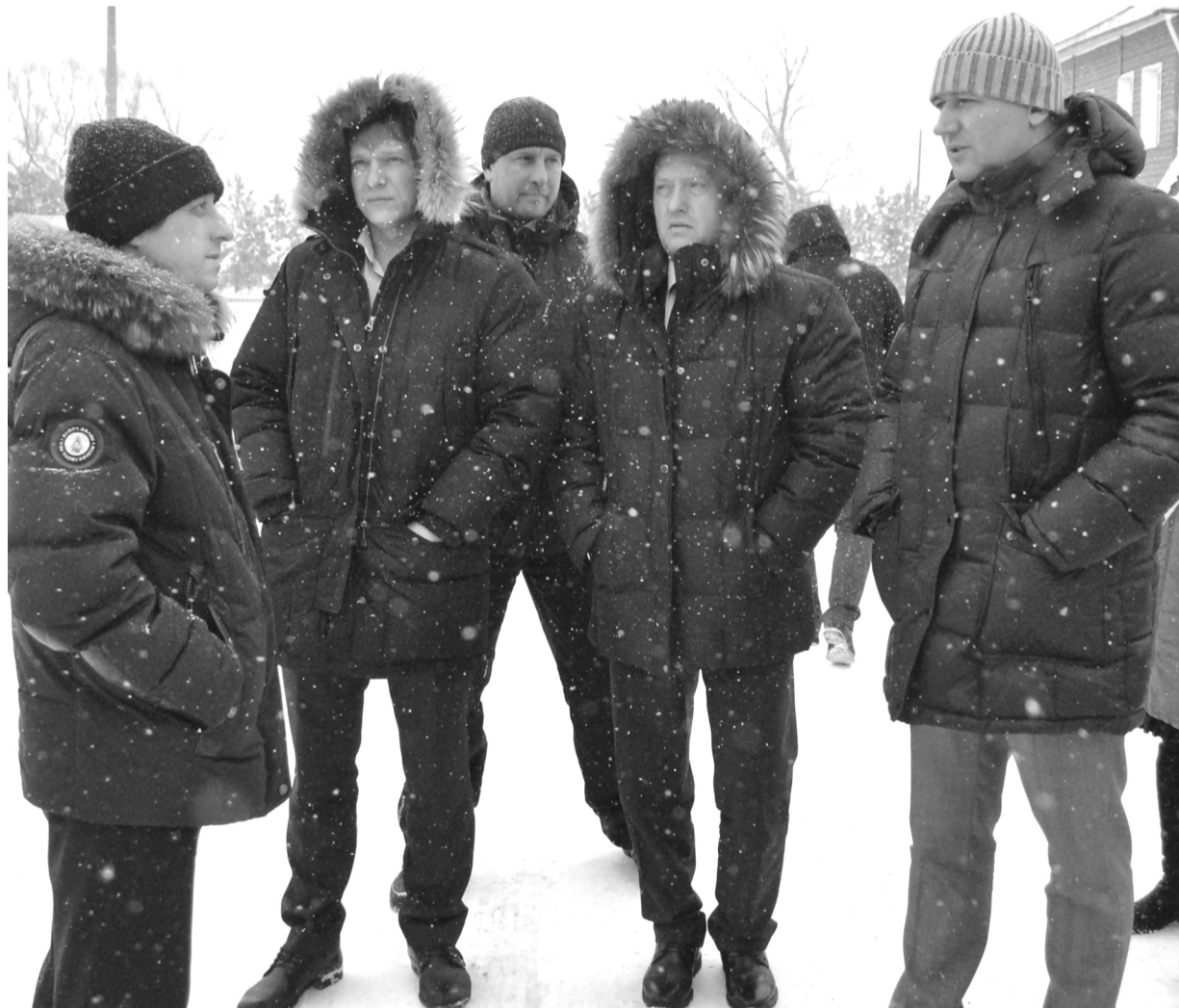
Павел Ростовцев (на снимке – справа) на стройке «Быстровозводимой крытой площадки»

Павел Александрович Ростовцев – российский биатлонист, политик, трехкратный чемпион мира, серебряный призер Олимпийских игр. Заслуженный мастер спорта России.