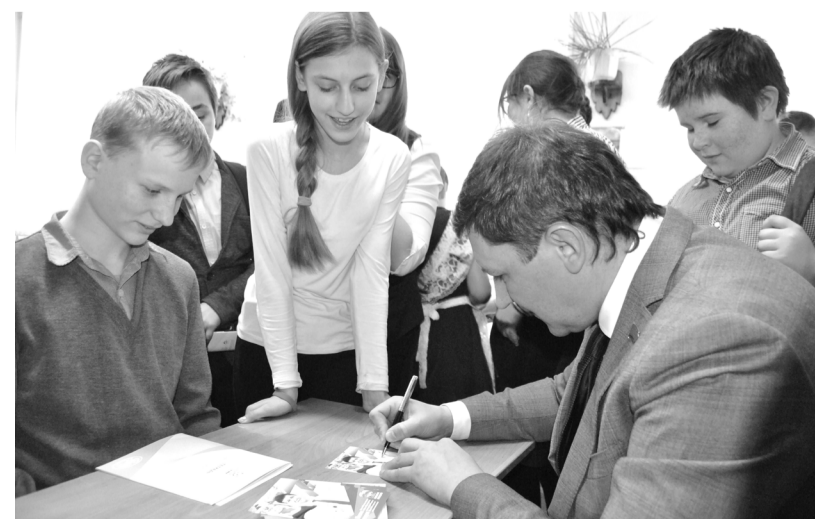
Автограф от чемпиона