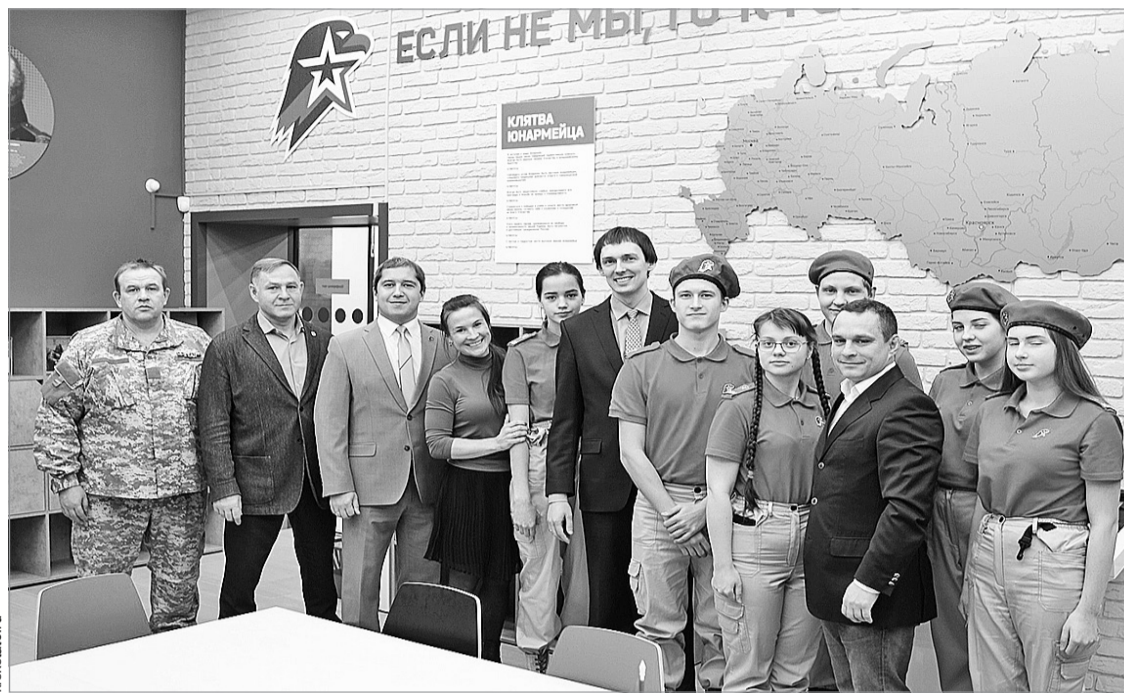
Открытие центра «Патриот» в Красноярске