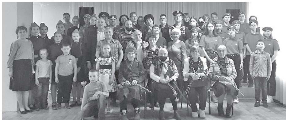
Участники автопробега на встрече с жителями Каратузского района

БЫЛА организована встреча старшего поколения – участников Великой Отечественной войны, тружеников тыла, детей войны с журналистами «АиФ» и молодежью. В РЛК «Спутник» состоялся небольшой концерт.