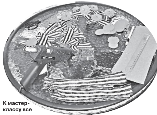
К мастер-классу все готово

Значки будут вручены участникам молодежных акций и творческих мероприятий, посвященных Дню Великой Победы.