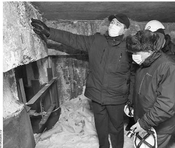
Евгений Афанасьев: «Совершенно очевидно, что без реализации комплексного плана невозможно решить вопросы жизнеобеспечения Норильска»

Этой теме министр посвятил отдельное совещание, тем более что настала пора подписывать новые договоренности с участием упомянутых сторон. Разработка стратегически важных документов для развития территории стала возможна благодаря активной позиции