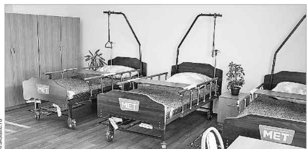
В новом корпусе интерната есть все для комфортного проживания и реабилитации пациентов