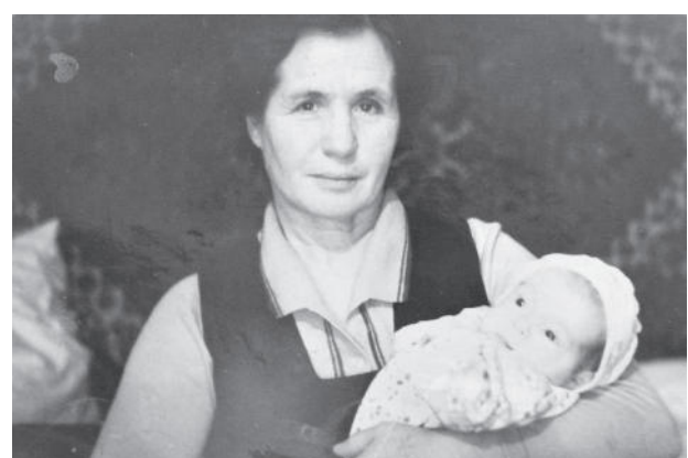
Валентина Михайловна с внучкой