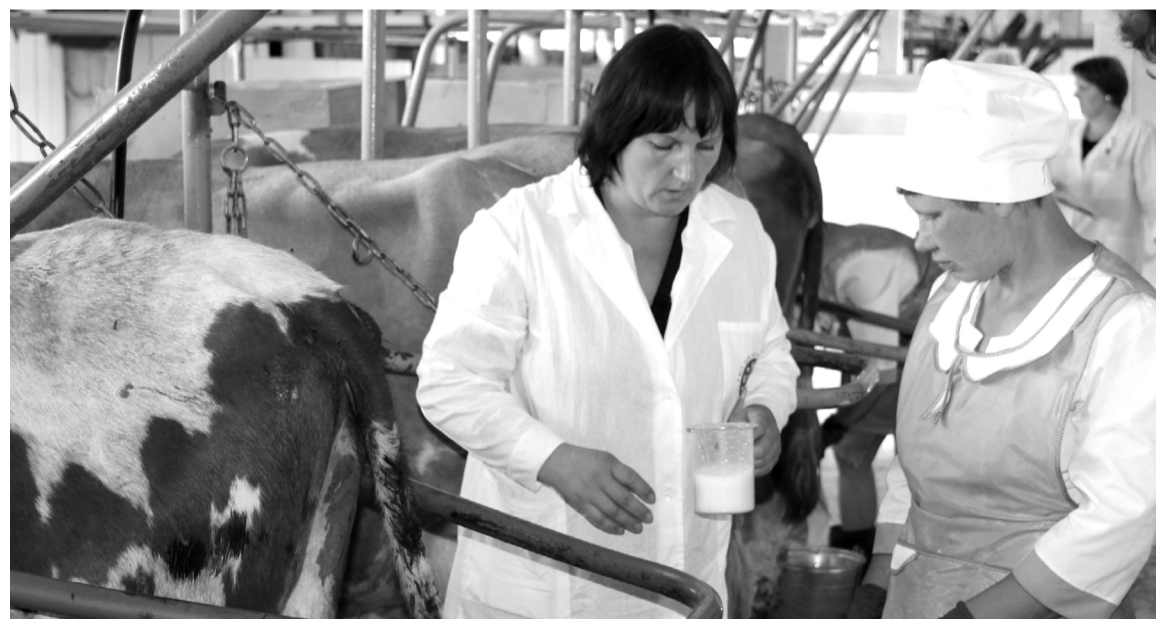
Проверка на полноту выдаивания