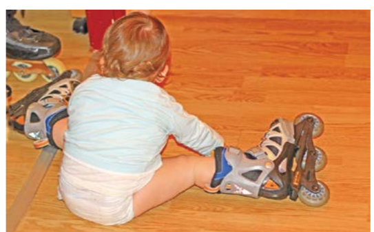
Ролики мы померили еще до года

25 января. Первый разговор по душам Когда Сонечке было три недели, она впервые закатила нам часовую концерт. Жена сказала, что это колики. Я перерыл горы книг, дабы выяснить, что же нужно делать при этих самых коликах, чтобы ребенок не мучился. Я забрал у жены орущую дочь и сказал, что справлюсь сам. Мы погасили все лампы, оставив лишь мягкий свет ночника. За окном по крышам стучал тихий дождь. Я по-