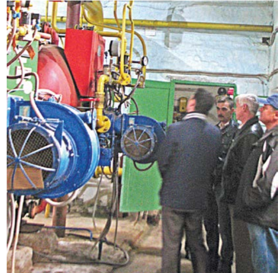
Блочная котельная в микрорайоне Сангорода к работе готова

Следующий выезд комиссии 12 сентября. По всем котельным будут составлены акты приемки с оформлением в дальнейшем паспортов готовности.