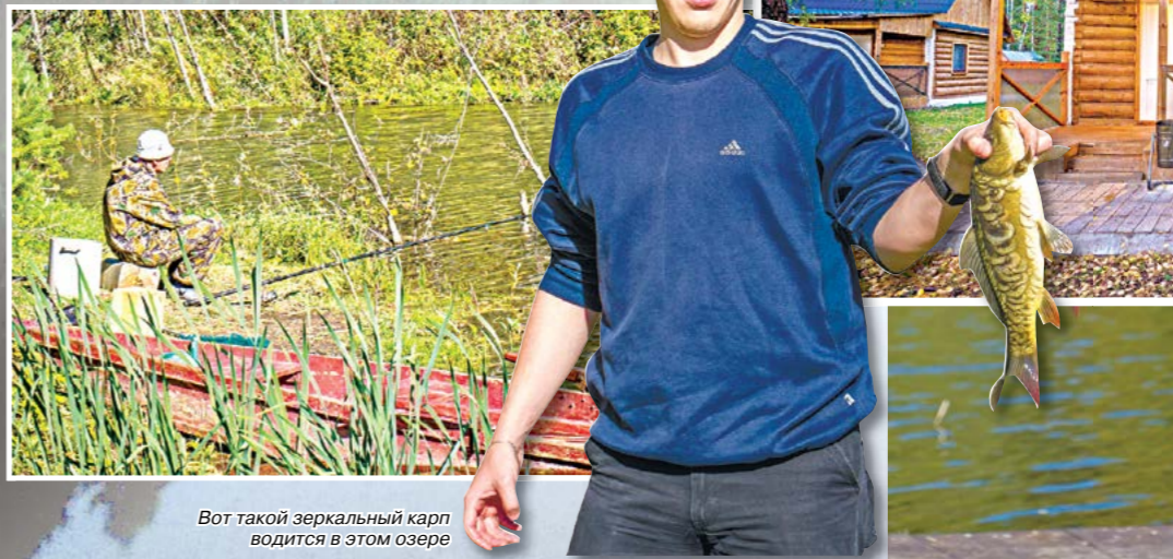
Вот такой зеркальный карп водится в этом озере