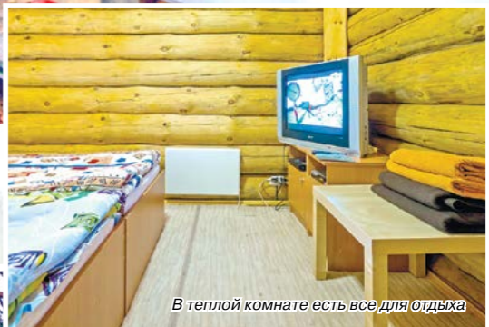
В теплой комнате есть все для отдыха

Н. СЕМЕНОВА На правах рекламы