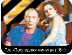
Т/с «Последняя минута» (16+)