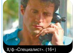
Х/ф «Специалист» (16+)