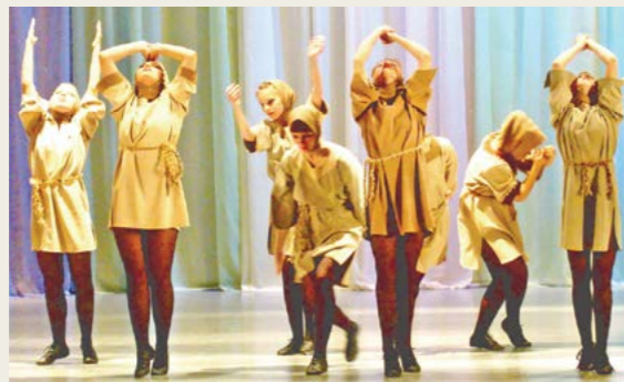
Старшая группа студии эстрадного танца "Шанс" исполняет танец "Женская доля"

О. БЕЛОУСОВ