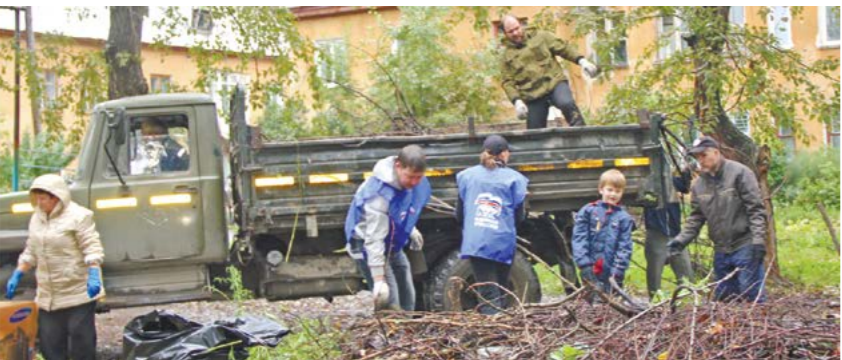
Дворно - не грузно!