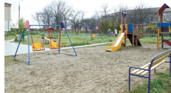
Детская площадка, построенная по областной целевой программе "Тысяча дворов"

На собраниях - всё та же картина маслом.