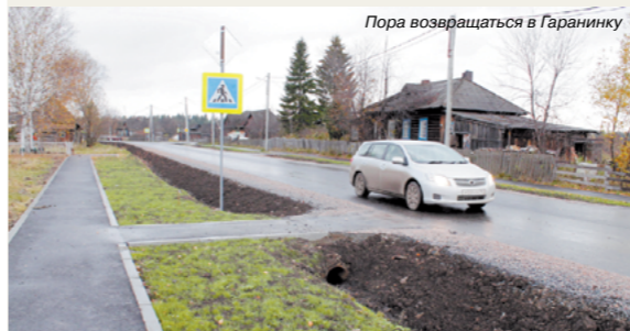
Пора возвращаться в Гаранинку