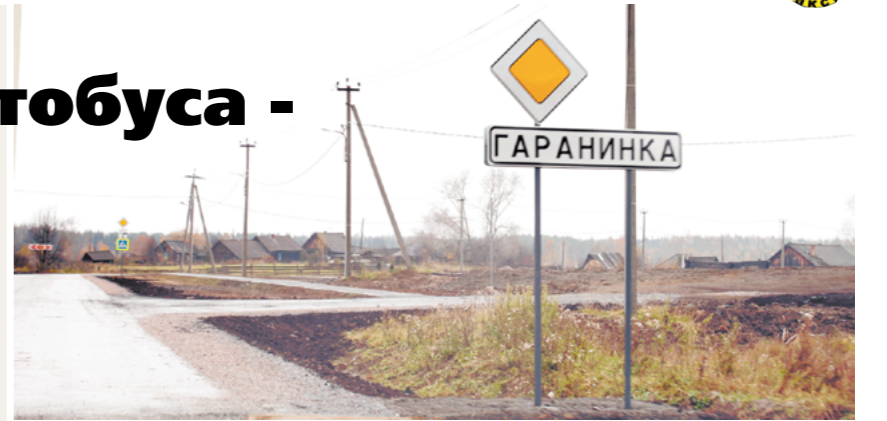
Гаранинская администрация и конечная остановка автобуса - Гаранинка