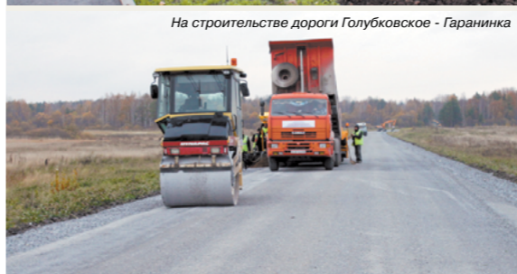
На строительстве дороги Голубковское - Гаранинка