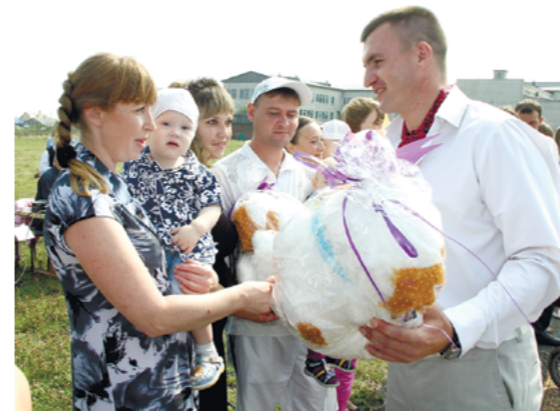
На празднике дня поселка

массу усилий и времени на решение пустякового вопроса, рискуя в итоге так его и не решить.