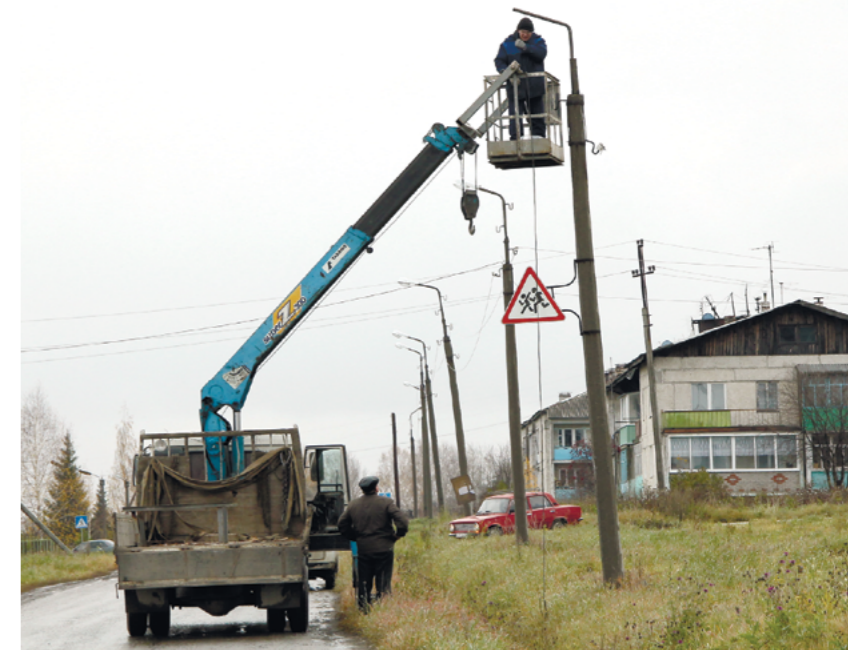
Сегодня по ночам Западный горит огнями ночного города

Главный врач ЦРБ разъяснил, что фельдшерский пункт в Западном никто закрывать не собирается, но вместо двух фельдшеров, как сейчас, останется один фельдшер и медсестра. Но при этом уже оснащены всем необходимым медицинские кабинеты в детском саду и школе, там проводится лицензирование медсестер, чтобы они прямо на месте могли проводить необходимые процедуры.