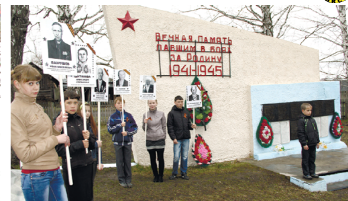
Помним... Акция "Бессмертный полк"