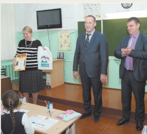
- Дети, а какой хотите следующий конкурс?

В.ЕГОРОВ При подготовке использованы публикации в "Российской газете"