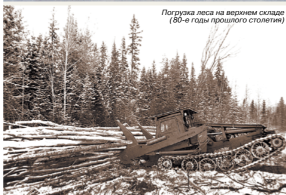
Погрузка леса на верхнем складе (80-е годы прошлого столетия)