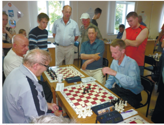
Здесь один ход может стать последним в борьбе...