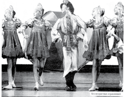
Филармонические проекты реализуются при поддержке Администрации МО «Городской округ Алапаевск» Свердловской области, Администрации Алапаевского городского округа Свердловской области, Администрации Алапаевского городского округа Свердловской области, Администрации Алапаевского городского округа Свердловской области.

Ансамбль танца «Улыбка» - один из лучших хореографических коллективов России. Юные артисты завоевали любовь и признание миллионов зрителей России, ближнего и дальнего зарубежья. «Улыбка» - обладатель Гран-При, лауреат и дипломант всемирных и международных конкурсов и фестивалей. Богатство и разнообразие репертуара дополняется искусным мастерством юных танцовщиц, выразительностью и увлеченностью исполнением.