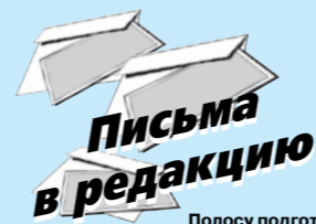
Полосу подготовила Н.ПЕРЕВОЗЧИКОВА

Нужно ли что-то добавлять? На поиск донора (который уже начат), доставку трансплантата в Санкт-Петербург, средств собранных алапаевцами, хватит. Но! Впереди операция и период реабилитации. Как говорят в фонде "Адвита", неизбежно понадобятся препараты, которые не покрываются квотой (операция финансируется из бюджета Свердловской области). А стоимость этих препаратов порой зашкаливает ценник в триста тысяч рублей. Так, что лишними деньги не будут. И если у алапаевцев есть возможность, не ограничивайте себя в добрых побуждениях!