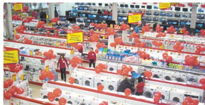
Акция «В честь открытия 250 магазинов! Прогнозируемые скидки до 50%!» действует с 05.11.14 по 26.11.14. Скидка до 50% действует при покупке за наличный расчет на рассрочку и онлайн на доставляемые. Прогнозируемая скидка может варьироваться в зависимости от наличия товара в магазинах. Скидка до 50% действует на товары, входящие в перечень товаров. Скидка до 50% действует на товары, входящие в перечень товаров. Скидка до 50% действует на товары, входящие в перечень товаров. Скидка до 50% действует на товары, входящие в перечень товаров.