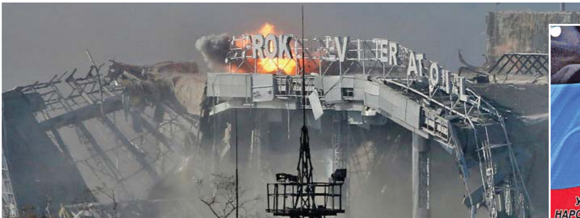
Бои за аэропорт Донецка

- Я буду тебя любить, я тебя не буду обижать, ты меня не бойся, - ласково говорил он. – Ты ведь совсем не страшный. Это я раньше тебя боялся, потому что думал, что ты злой, а теперь не боюсь!