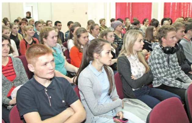
Выпускники-2015 на брифинге

В.ЕГОРОВ, по публикациям "Российской газеты"