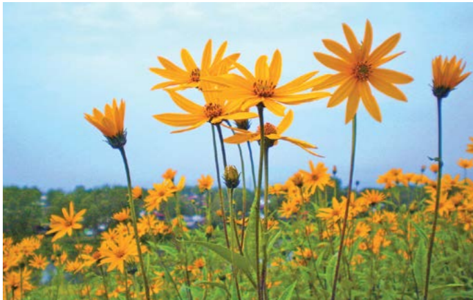
Немного долговечней человек цветка