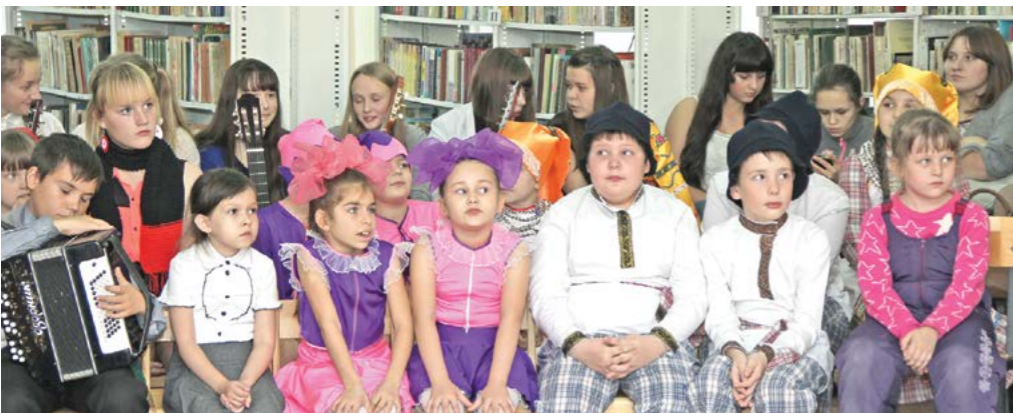
Юные артисты и активные читатели