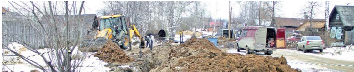
Работы по газификации идут в микрорайоне М.Горького

● В последующие годы часть с выбором ответа будет поэтапно исключаться из заданий ЕГЭ. Неизменными в этом году остаются требования к проведению государственной итоговой аттестации: единые пункты сдачи проведения государственного экзамена, оборудованные металлодетекторами и камерами наблюдения. Соблюдение этих условий направлено на защиту прав выпускника при рассмотрении конфликтных ситуаций.