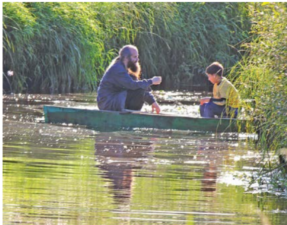
Смело верь тому, что вечно

О. БЕЛОУСОВ, фотоработы с выставки "Сны о Земле и Небе" В. Баякина