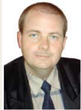
Подготовил юрист А. НОВГОРДОВ