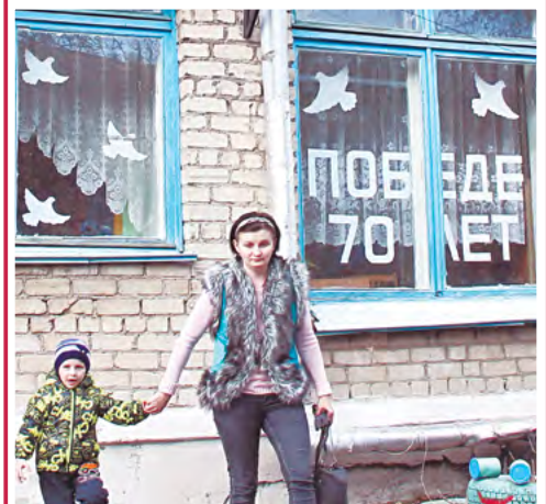
Голуби Победы и мира в детском саду №34