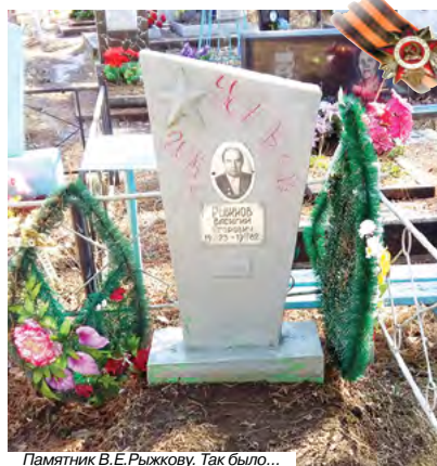
Памятник В.Е. Рыжкову. Так было...