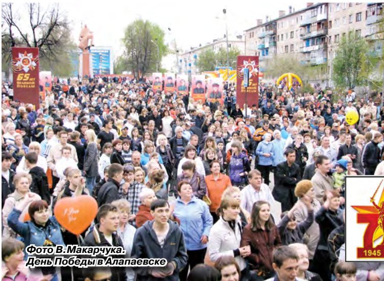
День Победы в Алапаевске