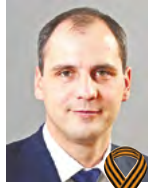
Д. ПАСЛЕР, председатель правительства Свердловской области

В этот знаменательный день 9 Мая желаю всем жителям Свердловской области мирного неба над головой, счастья и благополучия!