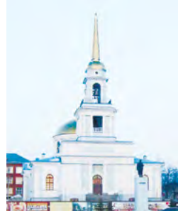
Церковь, в которой крестили П.И. Чайковского