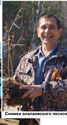
Снимки алапаевского лесхоза

Материалы подготовил В. ПЕРЕВОЗЧИКОВ, снимки Ю. Дунаева