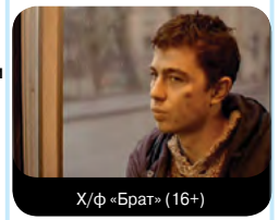
Х/ф «Брат» (16+)