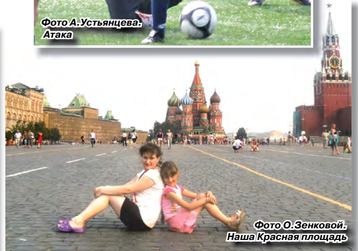
Наша Красная площадь