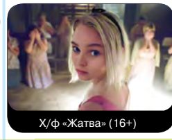
Х/ф «Жатва» (16+)