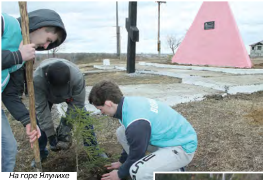
На горе Ялунихе

30 апреля близ алапаевского лесничества на Ялунихе высажена аллея лиственных деревьев в честь 70-летия Победы и в рамках акции "Зеленая волна". Участие в этой акции приняли работники 10 лесничеств, в том числе из Коптелово, Ясашной, Зенковки и других, а также из молодежных организаций города. Высажено около 100 саженцев. Всего в акции было задействовано более 100 человек. Акция продолжается!