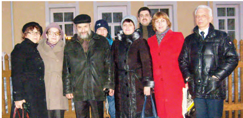
Потомки П.И. Чайковского и Е.А. Черемных (в центре)