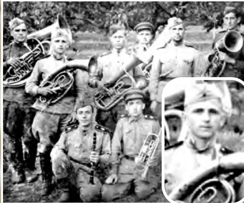
Берлин. Победа. Музыканты