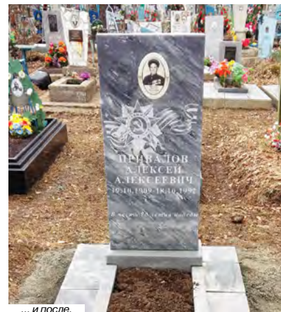
... и после.