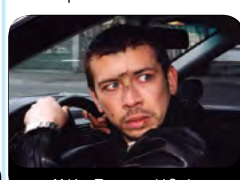
Х/ф «Бумер» (18+)