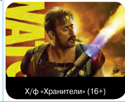
Х/ф «Хранители» (16+)