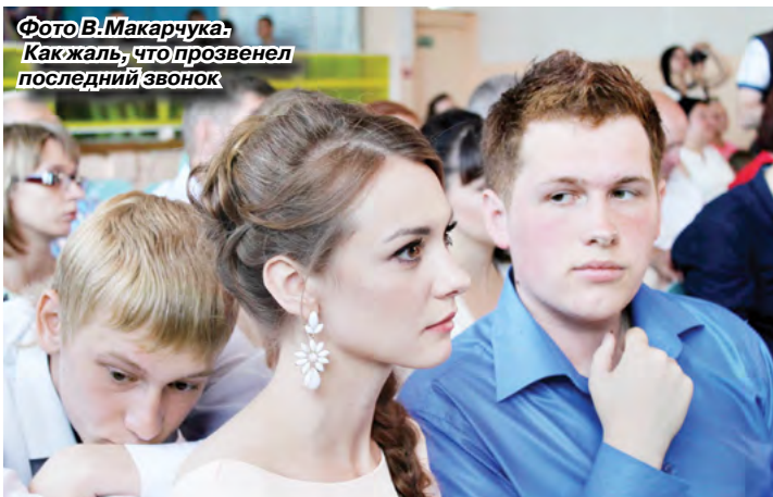
Как жаль, что прозвенел последний звонок