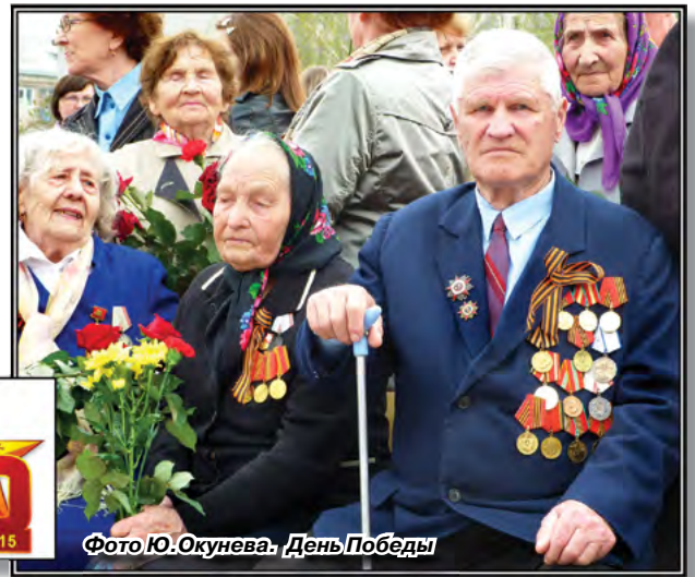
День Победы