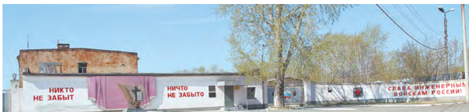
Воинская часть - здесь формировался 152-й отдельный батальон связи, который вошел в состав Уральского добровольческого танкового корпуса