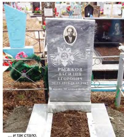
... и так стало.