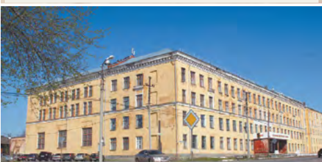
Алапаевский индустриальный техникум (во время войны - геологоразведочный) - здесь формировалась танковая часть