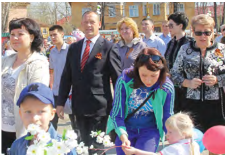
В. СЕРГЕЕВ

Праздник в целом прошел на высоте. Но, по площади прошли тысячи, а на митинге к его завершению осталось едва ли 100 человек: ветераны, администрация, КПРФ. Или других не волнует будущее города? Тут в самый раз сказать, что 1 мая - День солидарности трудящихся. Где же вы, товарищи?