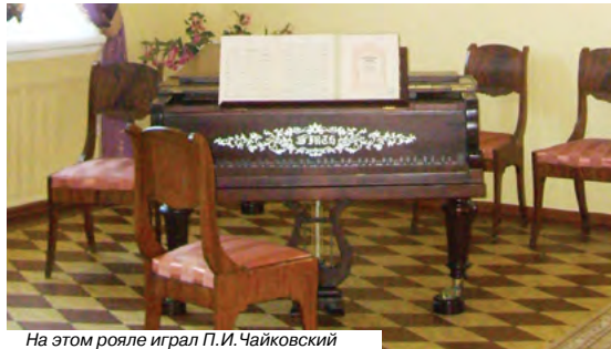
На этом рояле играл П.И. Чайковский