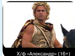
Х/ф «Александр» (16+)