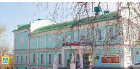
Алапаевский городской Дворец культуры (во время войны - Дворец культуры металлургов) - здесь находился сборный пункт перед отправкой на фронт