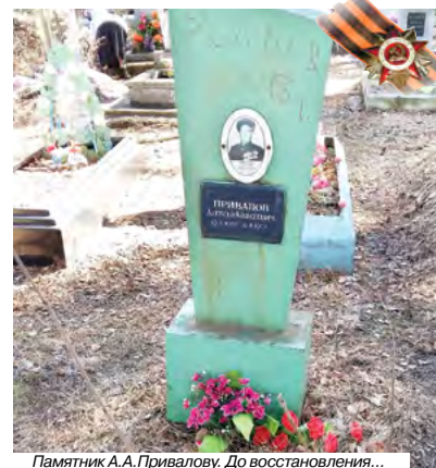
Памятник А.А. Привалову. До восстановления...