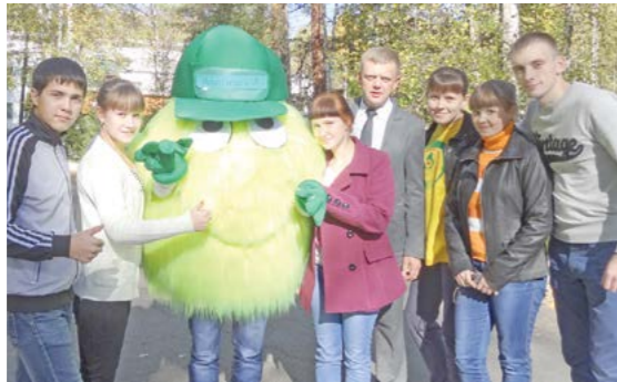
Команда волонтеров «Сердца молодых»

20-22 сентября в Серове на базе дома отдыха "Весёлый бор" состоялся 5-й областной студенческий форум учреждений среднего профессионального образования Свердловской области "Шаг в будущее", на который съехались команды волонтеров двенадцати филиалов медицинского колледжа Свердловской области - более двухсот человек.