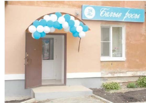
Открылся новый магазин «Белые росы» на ул.Софьи Перовской, 32