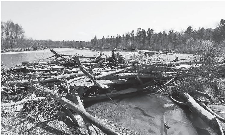
Фото участников акции «Дорогою Шибнева: 20 лет спустя» (г. Красный Яр). Такие заломы раньше скрывались под водой.

Двигаясь вверх и петляя по руслу, мы проезжаем устье реки Гунчжугу - по право-