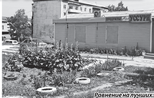
Равнение на лучших.

Недавно у нас открылся новый магазинчик «1000 мелочей». Хозяйка доброжелательная, учла наши пожелания по оформлению клумб, а также пообещала навести порядок с торцов торговой точки, заросших