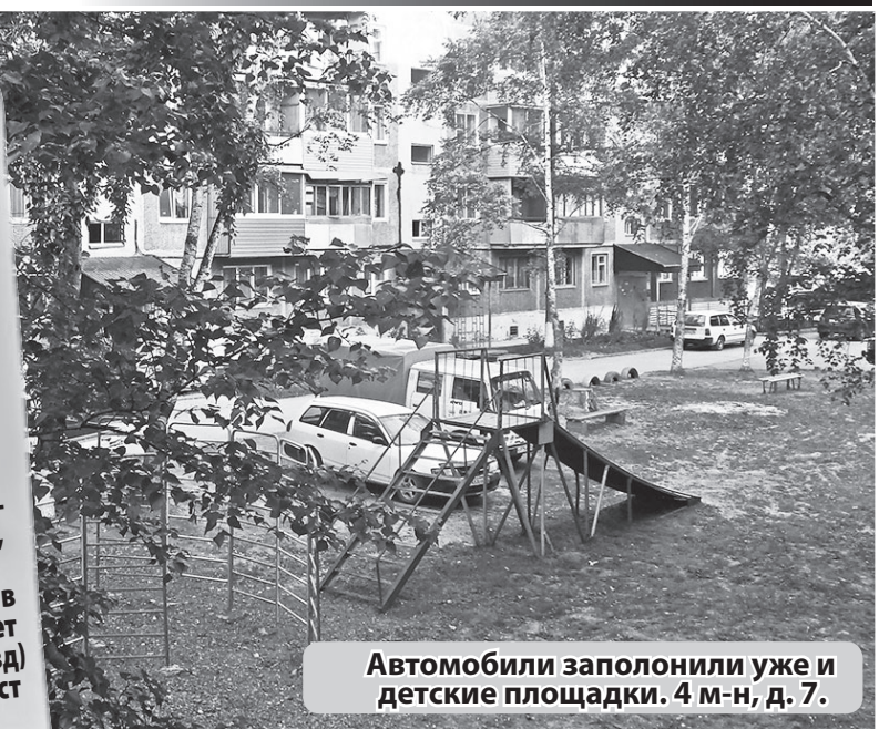
Автомобили заполнили уже и детские площадки. 4 м-н, д. 7.

Кстати, разрушенные газоны не только портят внешний вид территории, но и являются источником пыли, которая поднимается ветром в воздух и вызывает аллергические заболевания, особенно у детей. Нередки случаи, когда зеленый газон превращается в набитую колеями стоянку, и автолюбители уже со спокойной