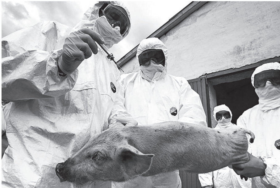
Средств для лечения и профилактики болезни НЕ СУЩЕСТВУЕТ!

• устанавливают карантин; • всех находящихся в эпизоотическом очаге свиней уничтожают бескровным методом. Трупы убитых и павших свиней, навоз, остатки кормов, тару и малоценный инвентарь, а также ветхие помещения, деревянные полы, кормушки, перегородки, изгороди