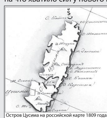
Остров Цусима на российской карте 1809 года.