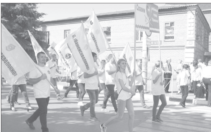
Шествие колонны АО «Каменскволокно» по пр. Карла Маркса.

Страницу подготовили журналисты корпоративной газеты «Прогресс» АО «Каменскволокно».