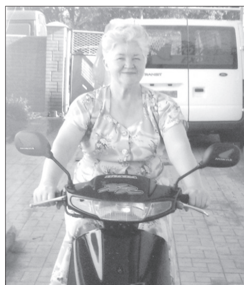
Жизнь - это движение вперед!

вешенность, интеллигентность, «умные» уроки вызвали чувство уважения и признательности среди учеников и коллег. Для нее характерны неиссякаемая энергия, неумение сидеть без дела. Прекрасный педагог, знаток детских сердец, она развивала в учащихся творческие способности, учила чувствовать и любить природу, быть воспитанными и чуткими. Сколько любви, сил, доброты, упорного труда потребовалось, чтобы за годы своей деятельности дать прочные, глубокие знания сотням учеников. А дома она была прекрасной хозяйкой,