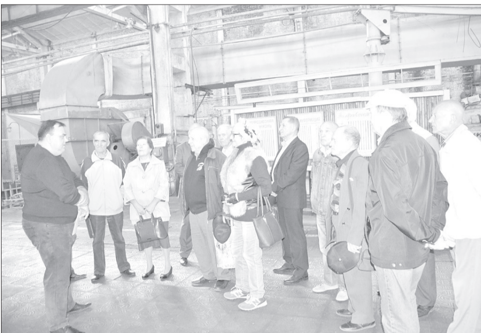
Экскурсия по заводу для ветеранов машиностроения.

Практически сразу я вернул на работу ранее уволенного сотрудника за-