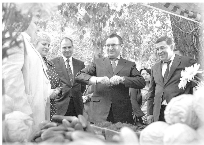
Губернатор Евгений Куйвашев и министр сельского хозяйства РФ Николай Фёдоров посетили Уральский аграрный университет в Екатеринбурге

Свердловская область может рассчитывать на федеральные субсидии для обновления парка сельхозтехники, которые будут выделены регионам в ближайшее время. Об этом заявил министр сельского хозяйства РФ Николай Фёдоров во время рабочей поездки на Средний Урал.