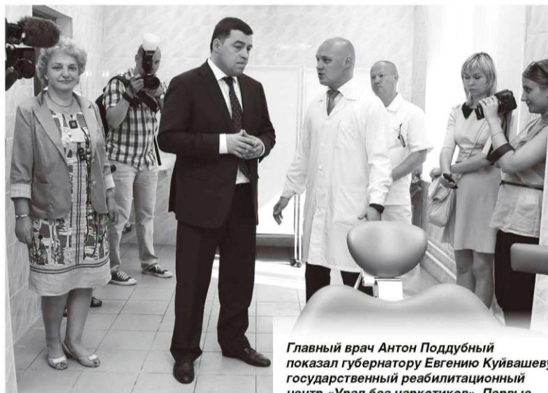
Главный врач Антон Поддубный показал губернатору Евгению Куйвашеву государственный реабилитационный центр «Урал без наркотиков». Первые пациенты - порядка 15 человек - начнут здесь лечение уже в июле.

Как только власти запрещают один вид наркотика, на рынке тут же появляется новый. Основные потребители запрещённых веществ - молодёжь от 13 до 18 лет.