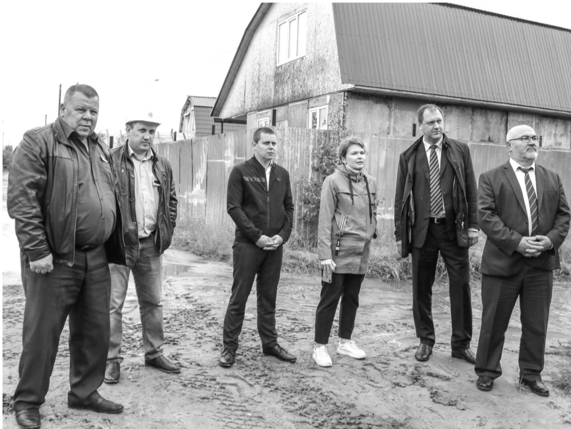
На данный момент строительно-монтажные работы ведутся в СОТ «Дачное»

Садовые кооперативы города Покачи обеспечены надёжным и бесперебойным электроснабжением