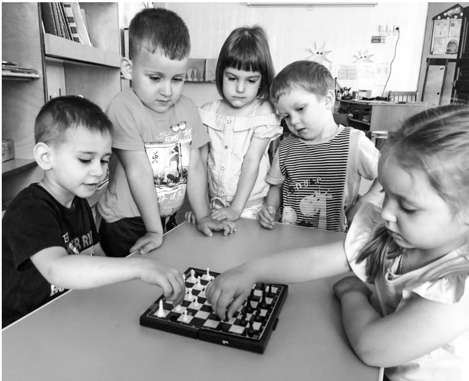
📷 Воспитанники МАДОУ ЦРР - детский сад отметили Международный день шахмат

В дошкольном образовательном учреждении ЦРР – детский сад педагоги в этот день провели для своих воспитанников познавательные занятия, посвященные шахматам, поговорили о различии шахмат и шашек. Ребята также сразились в интеллектуальных поединках, показав свои умения в этой игре. Дети посмотрели такие мультфильмы, как «Мудрые сказки тётушки Софы. Шахматы» и «Фиксики – Шахматы». День, посвященный игре королей, прошел в дошкольном учреждении интересно и увлекательно.