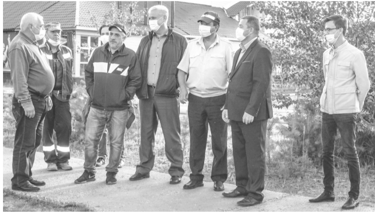
По мнению комиссии, пешеходные переходы соответствуют требованиям дорожной безопасности

Во время прямого эфира глава города Покачи Владимир Степура прокомментировал, что пешеходный переход на перекрестке Ленина, 3,5 и авто-