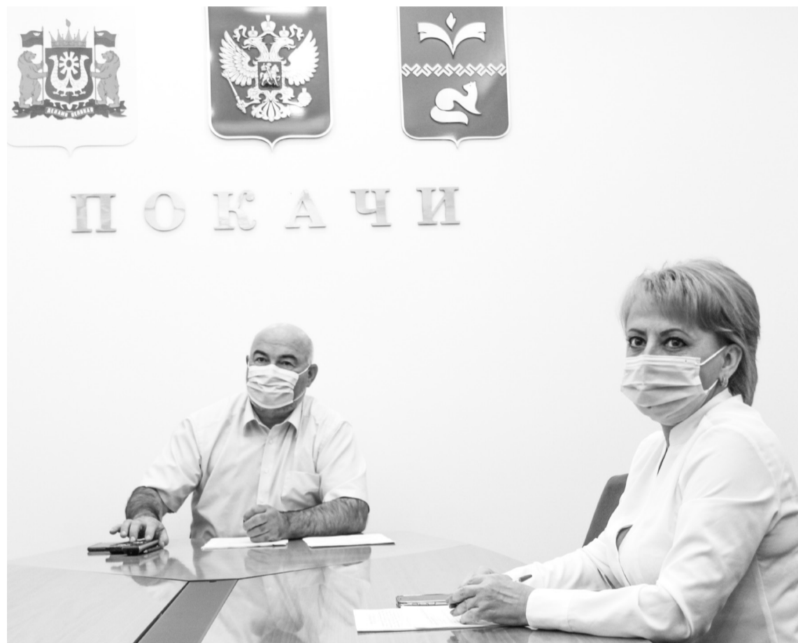
Город Покачи принял участие в заседании регионального оперативного штаба по COVID-19

27 июля Губернатор Югры Наталья Комарова в формате видеосвязи провела заседание регионального оперативного штаба по COVID-19