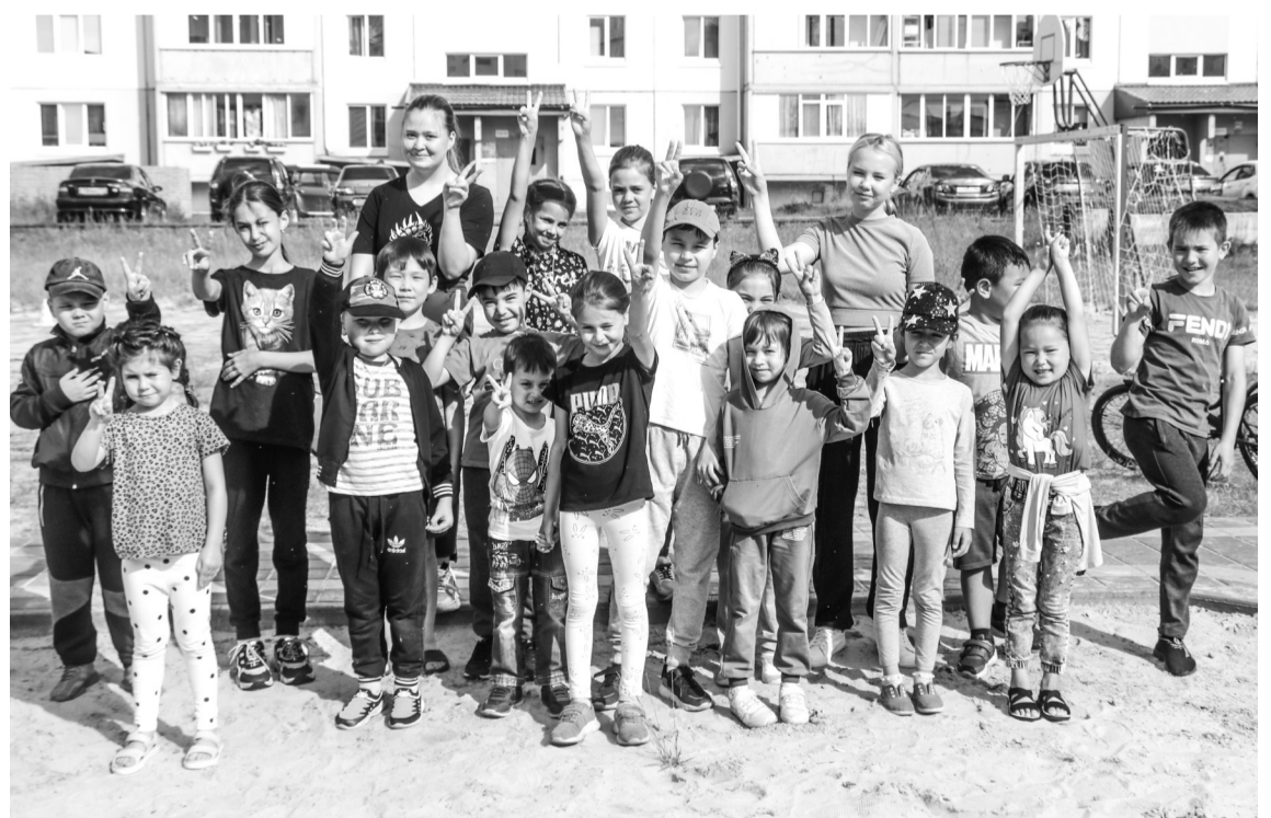
В честь Десятилетия детства на спортивных площадках «Непоседы» прошла эстафета «Дружба - сила, дружба - смех»

Когда все были в сборе, участники разделились на две команды. Конечно, по традиции дети дали им названия. В итоге за победу боролись «Абу-