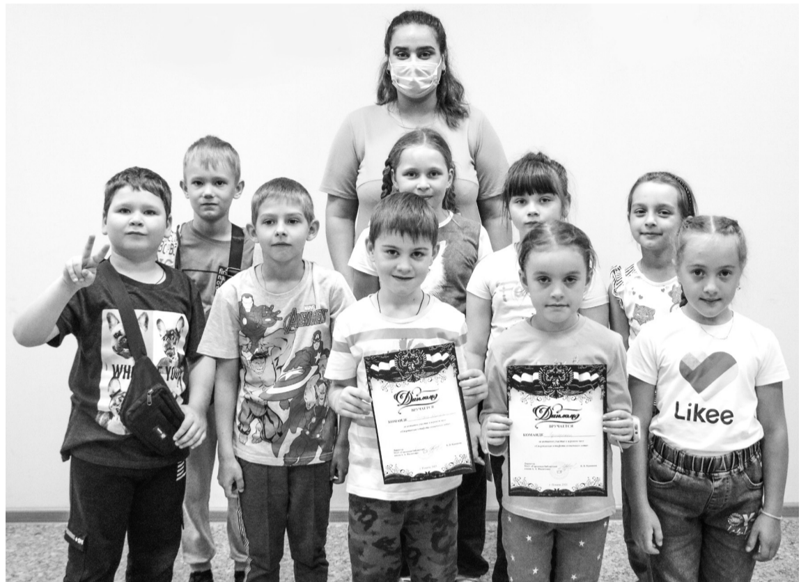
Воспитанники лагеря «Солнышко» посетили дворовый клуб «Читалки-вытворялки» на базе Городской библиотеки им. А.А. Филатова

Сотрудники библиотеки подготовили для воспитанников лагеря интересные подвижные состязания. Всего ребят ожидало шесть увлекательных эстафет: «Шарики-веники», «Пугало», «Одноножка», «Стремянка-мишень», «Кто обгонит?», «Каждый эстафета проходила очень весело и задорно. А как ребята