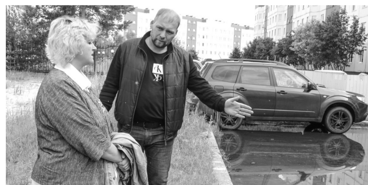
■ Сейчас прорабатывается вопрос по коммерческому предложению на выполнение работ по обустройству локальных ливневых колодцев

Надо отметить, что во время проведения экспертизы во многих дворах вода уже впиталась в почву. Те лужи, которые остались, не мешают пешеходам. Но все же вопрос по скоплению воды решили не откладывать в долгий ящик. Специалисты обсудили возмож-