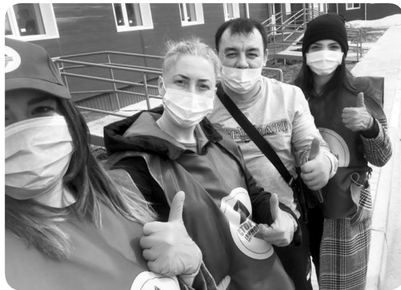
Во всех регионах страны партия разведения волонтерские центры

Помимо этого, волонтеры и партийцы в рамках партпроекта «Народный контроль» продолжают мониторинг цен и наличие товаров первой необходимости в магазинах города, проверяют соблюдение режима самоизоляции в общественных местах, а также соблюдение предписанных ограничений предпринимателями, строительными организациями и точками общепита.