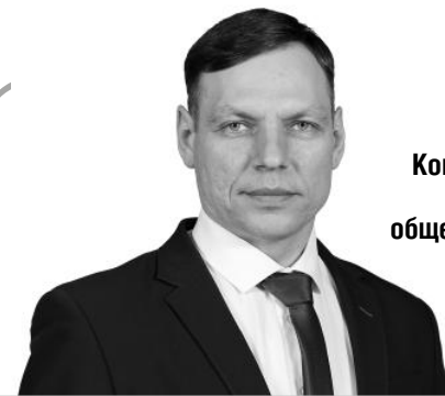
Комментарий от лидера общественного мнения

«В Российской Федерации в соответствии с федеральным законом гарантируется обяза- тельная социальная поддержка граждан и индексация социаль- ных пособий и иных социальных выплат».