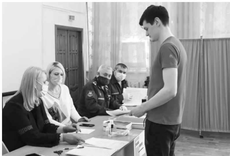
В г.Покачи в апреле прошла медицинская призывная комиссия

Несоблюдение данных требований влечёт предупреждение или наложение административного штрафа по статье 21.5 КоАП РФ в размере от ста до пятисот рублей.