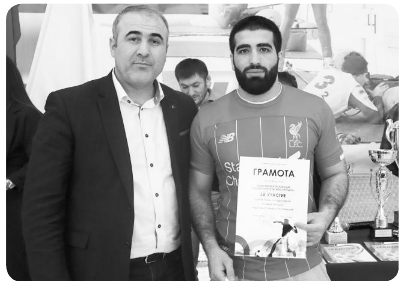
Общественная организация «Дружба народов Дагестана» проводит спортивные мероприятия, принимает активное участие в патриотическом воспитании подрастающего поколения, в общественной жизни города

– В феврале 2020 года на заседании Совета Общественной палаты Югры в городе Нижневартовске были приглашены представители органов местного самоуправления города Покачи и социально ориентированных