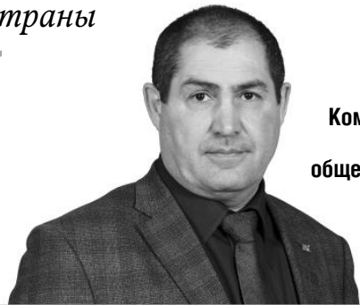
Комментарий от лидера общественного мнения

«Правительство Российской Федерации: ...обеспечивает реали- зацию принципов социального парт- нёрства в сфере регулирования трудовых и иных непосредственно связанных с ними отношений».