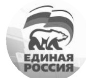
Политсовет Местного отделения г. Покачи Всероссийской политической партии «ЕДИНАЯ РОССИЯ»

От всей души желаю вам крепкого здоровья, счастья, мира, весеннего настроения!