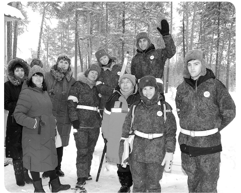
Одно из ярких мероприятий АНО «Вектор доброты» - «Зарница»

Это покачёвцы, которые способны не только профессионально участвовать в решении актуальных задач городского сообщества и оказывать услу-