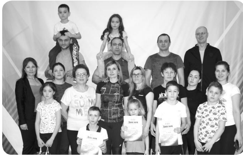
Отрадно, что количество привлечённых к сдаче норм ГТО покальцев из года в год растёт

Все покальцев результаты самодисциплины!