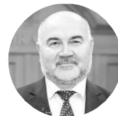
Владимир СТЕПУРА глава города Покачи