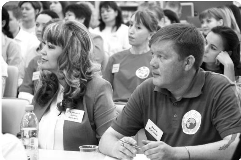
Проекты общественной организации «Третья планета от Солнца» отмечены грантами Президента РФ и Губернатора Югры

Используется такой механизм финансирования, как конкурентные способы закупки услуг для населения в рамках законодательства о контрактной системе, целевые потребительские субсидии на получение услуг (сертификаты), закупки в рамках законодательства о контрактной системе у единственного поставщика. Осуществляется возмещение фактически понесённых затрат социально ориентированной некоммерческой организацией.