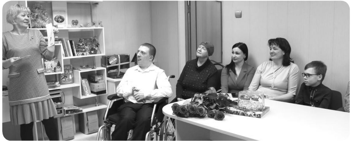
АНО Центр семейного устройства «Счастье в детях» - центр притяжения тёплых и дружеских встреч

На базе Местной православной религиозной организации «Приход храма Покрова Божией Матери» ежегодно осуществляется деятельность лагеря с дневным пребыванием детей «Неофит». В 2019 году охват детей составил 50 человек.