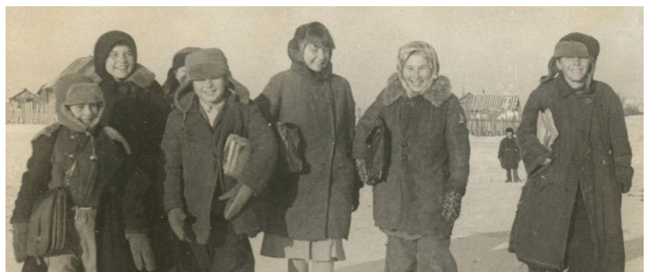
Страницу подготовила Галина НОСАЕВА.

Тепла и света в детских душах. Мы - однокашники по классу - В обносках от сестер и братьев Являли сказочную массу Без всяких карнавальных платьев. Дед Мороз в фуфайке от нужды, С усами, с бородой из старой ваты, Но шапка со следами от звезды В нем выдавала бывшего солдата. В мешке негласные подарки. Не угадать, как ни смотри: Газетный сверток с перевязкой С щербатым пряником внутри. Нам, досыта хватившим лиха, Были за лакомство тогда Обломки соевого жмыха, Служившего кормом для скота. Но мы учились нищете в ответ, Не зная электрического света. Мы твердо знали, что ученье - свет, Что нет страны прекраснее на свете!