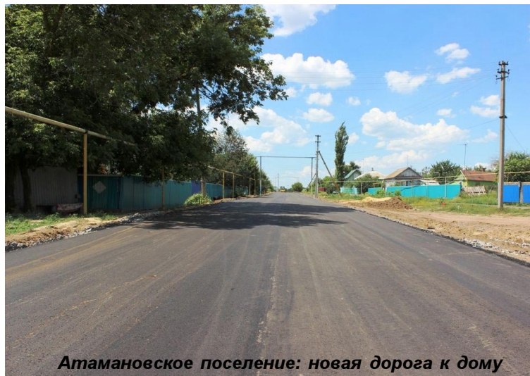
Атамановское поселение: новая дорога к дому

Напомним, что строительство подъездной дороги к хутору Рогачи реализовано в рамках двух государственных программ: «Устойчивое развитие сельских территорий» и «Развитие транспортной системы региона». А повышение инфраструктуры и качества жизни людей на селе - одно из важных направлений в долгосрочной стратегии губернатора Волгоградской области.