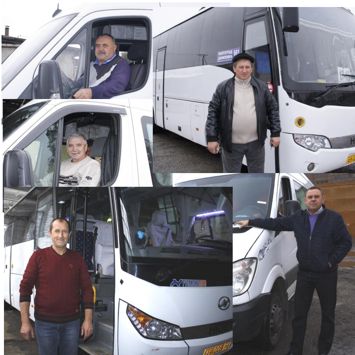
Водители автотранспортного предприятия поздравляют коллег с профессиональным праздником, желают хороших пассажиров, отличных дорог, всего самого лучшего. Ни гвоздя, ни жезла!

Уделяют большое внимание здесь и работникам учреждения, и самим машинам. На предприятии созданы нормальные условия для труда, построен еще