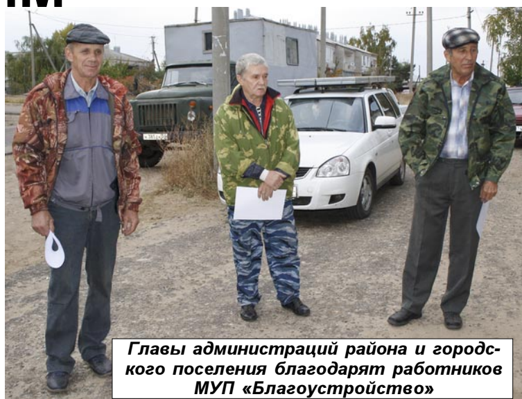
Главы администраций района и городского поселения благодарят работников МУП «Благоустройство»