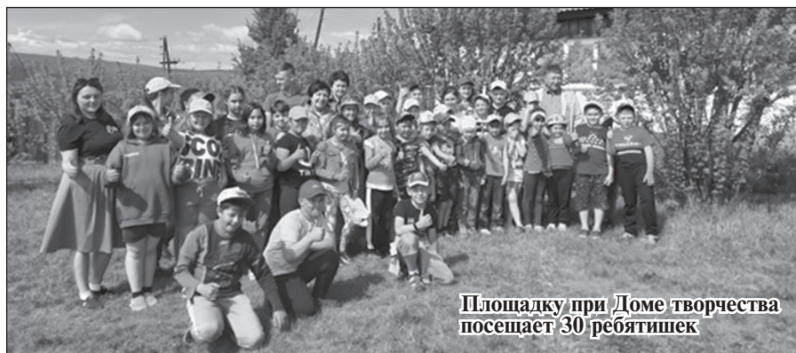
Площадку при ДOME творчества посещает 30 ребятишек