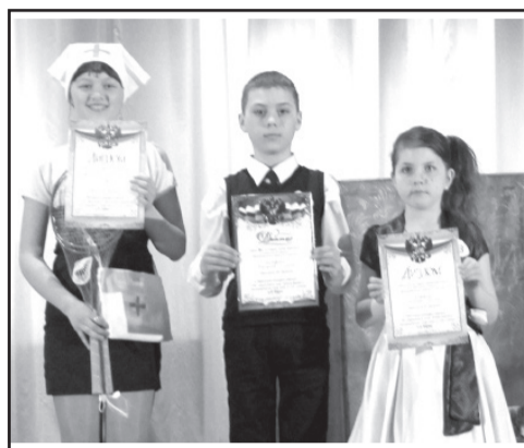
Конкурс чтецов. Стр. 3