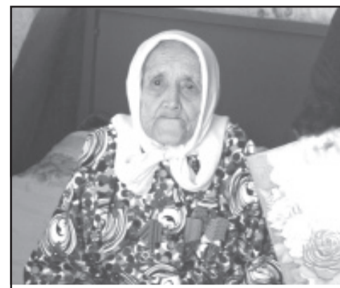
Юбилеры. Стр. 4