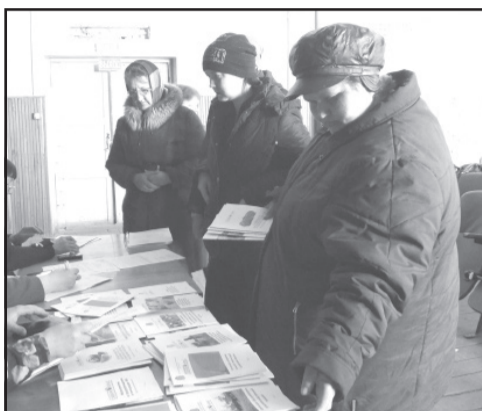
Семинар в Никитинке. Стр. 2