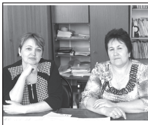
Праздник «культурных» людей. Стр. 3