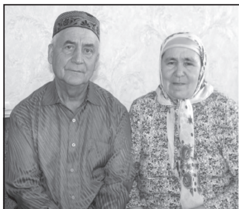
Более 40 лет вместе. Стр. 6