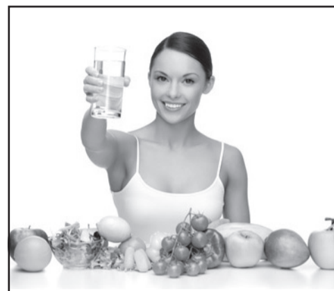
Страничка советов. Стр. 9