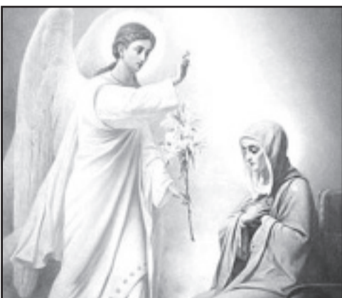
Благовещение. Стр. 4