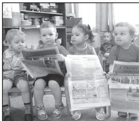
7 причин подписаться. Стр. 8