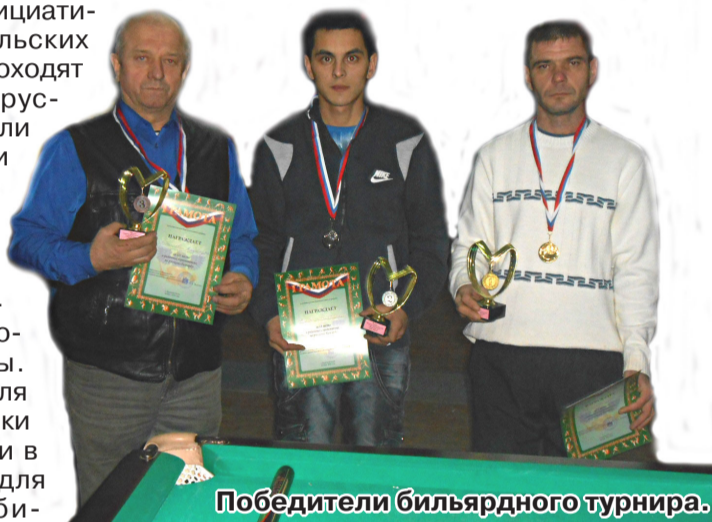
Победители бильярдного турнира.