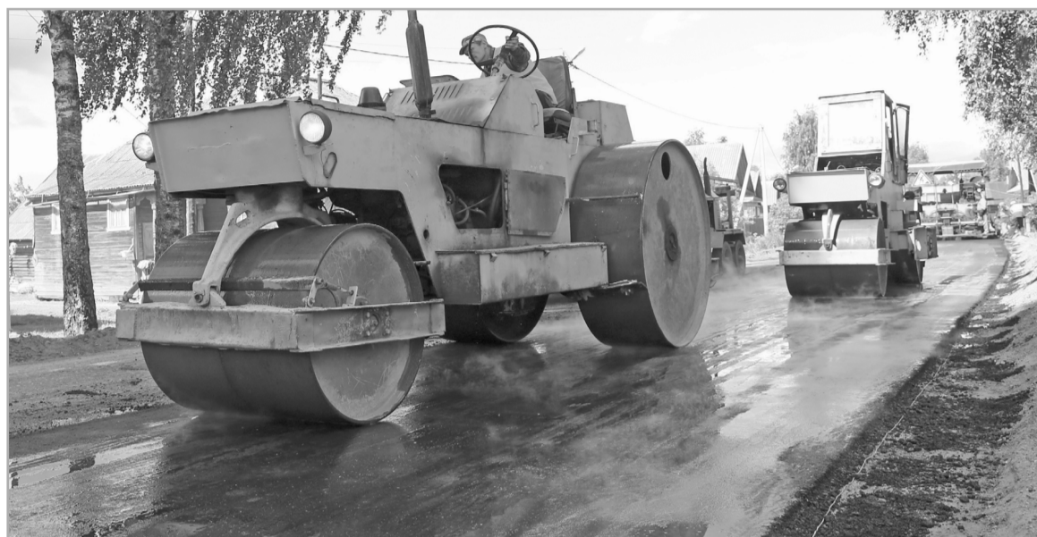
Хорошие дороги открывают новые возможности развития экономики

В нынешнем году здесь ждут еще больше гостей в связи с празднованием значимой для многих православных дат – 350-летия обретения мощей Нила Столобенского. Есть надежда, что за дороги, которые ведут к монастырю и к озеру Селигер, попавшему в сотню самых узнаваемых региональных брендов России, краснеть не придется. Потому что региональная власть намерена в этом году привести их в нормативное состояние. Будут отремонтированы подъезды к Нило-Столобенской пустыни Залесье – Сорога – Ореховка – Дубровка и Сорога – Залучье – Светлица в Осташковском районе общей протяженностью 20