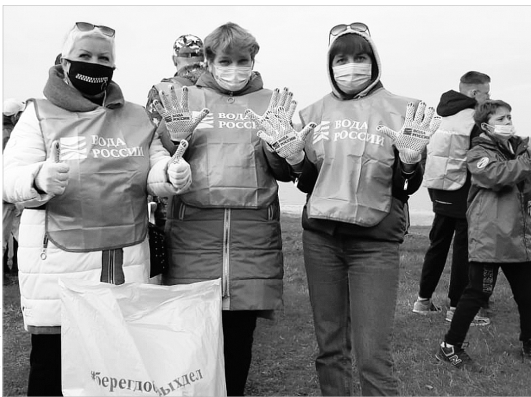
На уборку берегов Волги в Конаково вышли 250 эковолонтеров

Также в ходе встречи обсуждался вопрос реализации Правительством Тверской области и Группой компаний «Ренова» совместных инвестиционных проектов на территории Верхневолжья. Речь шла о размещении площадок машиностроения в технопарках региона и участие Группы компаний в проекте по развитию туристических кластеров в Тверской области.