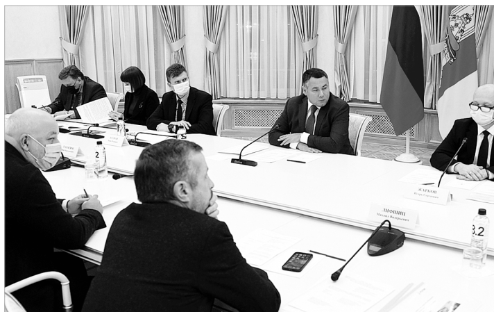
Рабочая встреча в Твери: слева Виктор Вексельберг, в центре Игорь Руденя

формация – на сайте берегодобрыхдел.рф. По всем вопросам можно также обращаться по телефону: (4822) 73-31-70.