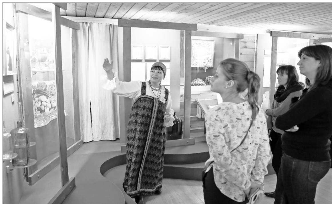
Краеведческие и тематические музеи в муниципалитетах могут стать точками притяжения для туристов. У самых интересных объектов есть перспектива стать частью комплексного туристического продукта, продвигаемого на конкретной территории

И, конечно, необходимо информацию о таких учреждениях сделать доступной. Чтобы и по указателям можно было музей легко найти, въезжая в населенный пункт, и в Интернете посмотреть график работы и возможность организации экскурсий. Отчасти поможет в