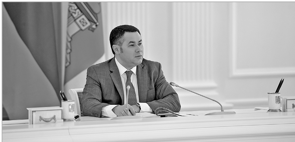
Игорь Руденя занял пост губернатора Тверской области в 2016 году

Разумеется, нашедшие на «дойную корову» в виде тверского ЖКХ коммерсанты не желали сдаваться просто, а потому эпопея длилась еще некоторое время – со скандалами и громкими судебными процессами. Однако уже вскоре областной центр забыл о шантаже с выколачиванием невесты откуда взявшихся долгов и холодными батареями. Финансовый поток развернулся в сторону городского бюджета, а сомнительные фирмы вынуждены были уйти со сцены. Конечно же, ветхие коммуникации, оставленные городу предыдущими собственниками, невозможно было восстановить на раз, будто по мановению волшебной палочки. Но главное – заработал четкий прозрачный механизм, когда жители оплачивают квитанции, а деньги идут как раз на содер-