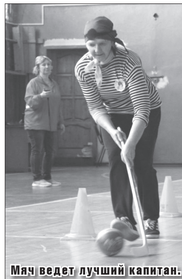
Мяч ведет лучший капитан.

И все же здесь не было победителей и проигравших, были только люди, довольные прошедшим ярким мероприятием. Все благодарны за